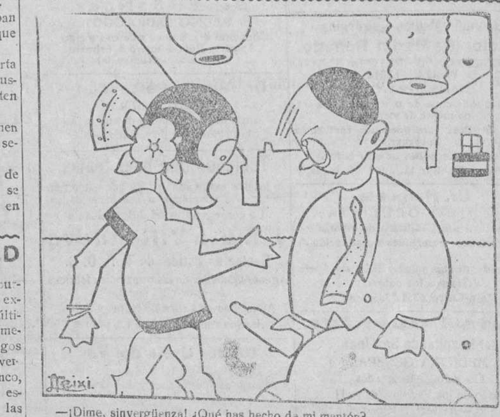
— ¡Dime, sinvergüenza! ¿Qué has hecho de mi mantón? — ¿De tu mantón?... Pues ya lo estás viendo; cambiálo por una toquilla.

ZOTAL Para desinfectar habitaciones y utensilios de los enfermos. Laboratorio Zotal.—Sevilla