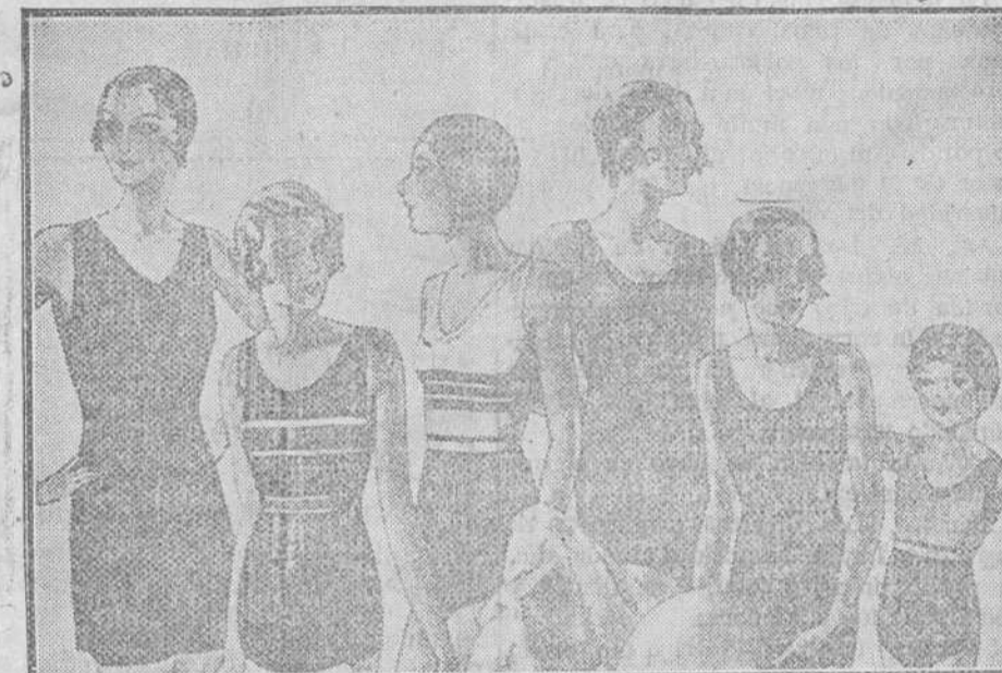
Trajes de baño, diversidad de modelos, en algodón y lana, a pesetas 3'50, 4, 5, 6, 8, 10 y 15