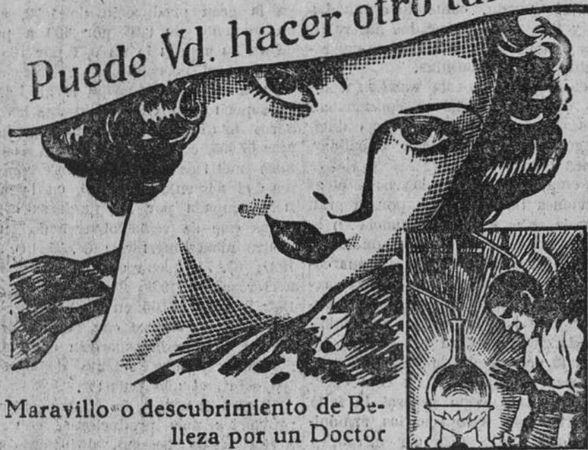
Maravilloso descubrimiento de Belleza por un Doctor

Es fácil, ahora, blanquear, refrescar y rejuvenecer una piel marchita y aviejada. La Ciencia ha logrado descubrir el elemento vital y rejuvenecedor de la piel. Cuando, mediante un movimiento vibratorio, se le hace penetrar en la piel, las arrugas desaparecen, los poros dilatados, las espinillas e imperfecciones de la tez se disipan por completo. Este elemento vital y rejuvenecedor, obtenido de animales jóvenes, está contenido ahora únicamente en la nueva Crema Tokalon, la famosa crema parisiense. La acción tónica y embellecedora que dicho elemento ejerce sobre la piel produce ese esplendor de salud y de juventud que surge de los tejidos subcutáneos y proporcióna al rostro, por fco que sea, la belleza más sorprendente.