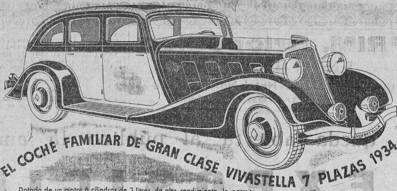
EL COCHE FAMILIAR DE GRAN CLASE VIVASTELLA 7 PLAZAS 1934