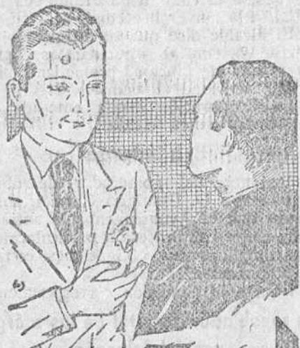
¡Lo lo descuide...

Ese ardor de estómago que nota después de las comidas puede ser la úlcera de mañana. Consiga su curación inmediata con el