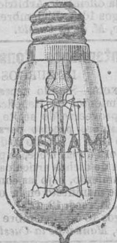
Toda lámpara «Osram» legítima lleva la marca «OSRAM» grabada en el cristal.

LEON ORNSTEIN - Madrid - Mariana Pineda, 5