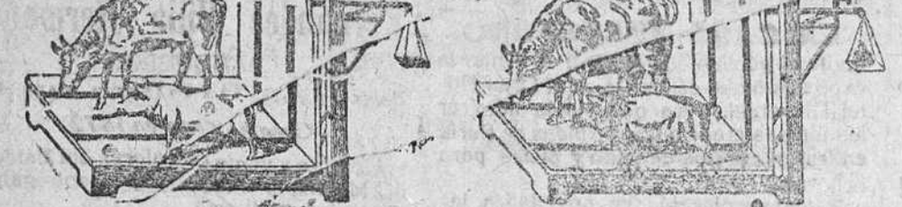
Demostración del resultado de este preparado: Cerdo que ganó en veinte días de 10 a 15 kilos y la vaca de 45 a 50.

Las gallinas ponen doble número de huevos y pierden el vicio de comérselos, las evita esa enfermedad que tanto las persigue y ponen dos meses antes las jóvenes. Como en la composición de este preparado entran elementos que forzosamente tienen que resultar para este objeto y dosificados como van escrupulosamente.