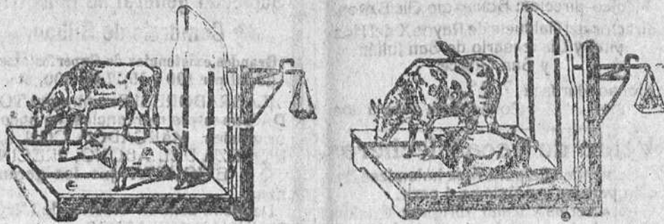
Demostración del resultado de este preparado:

Cerdo que ganó en veinte días de 10 á 15 kilos y la vaca de 45 á 50.