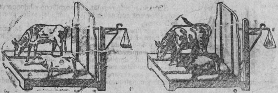
Demostración del resultado de este preparado:

Las gallinas ponen doble número de huevos y pierden el vicio de comérselos, las evita esa enfermedad que tanto las persigue y ponen dos meses antes las jóvenes. Como en la composición de este preparado entran elementos que forzosamente tienen que resultar para este objeto y dosificados como van escrupulosamente.