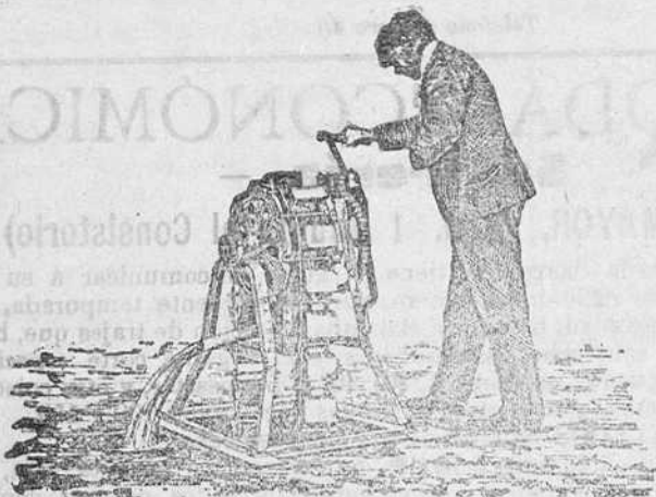
Noria de mano

Para su desarrollo se necesita socio capitalista con 10.000 pesetas. En esta administración informarán.