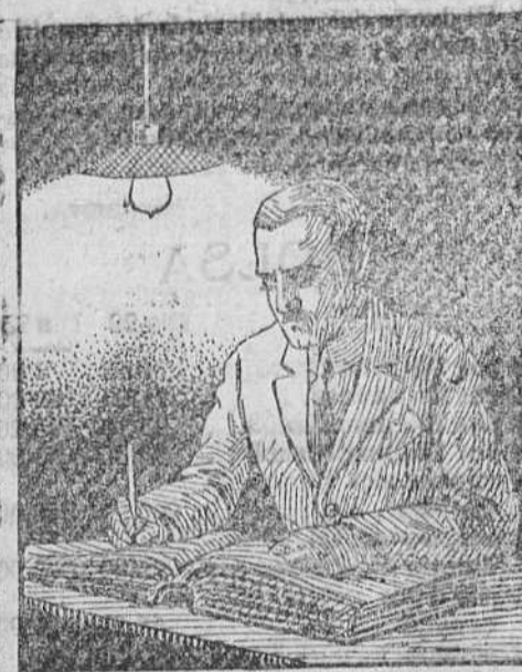
TRABAJANDO CON LÁMPARA DE FILAMENTO METÁLICO