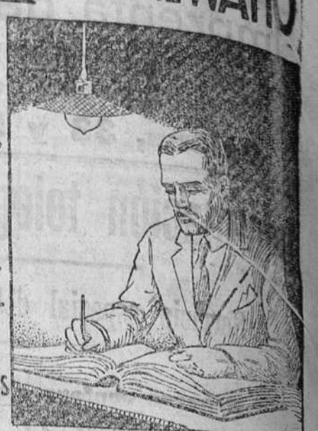
TRABAJANDO con PHILIPS ARGON LLENA DE GAS ARGON

Es inútil ocultar la verdad. Las modernas lámparas PHILIPS-ARGA sustituirán en breve plazo las de filamento metálico, que ya no convienen.