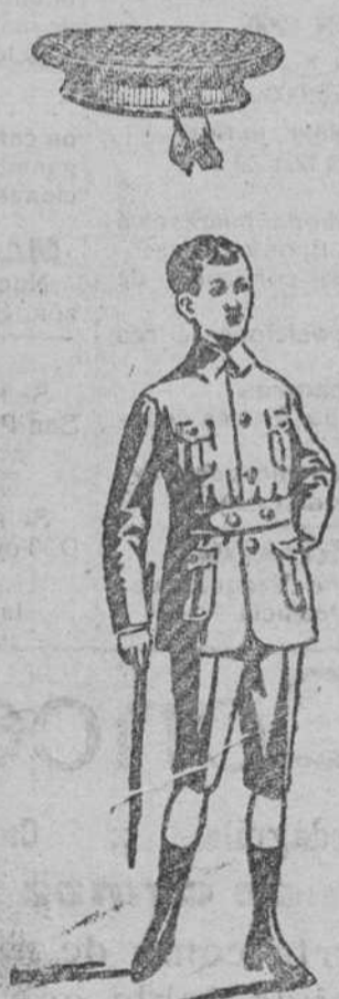
Trajecito forma sport de dril á 18, 20 y 25 pesetas.