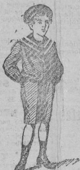
Trajecitos dril á 8, 10, 12, 15, 20 y 25 pts.