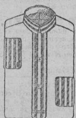
Camisas cuello y puños novedad á 10, 12 y 14 pesetas.