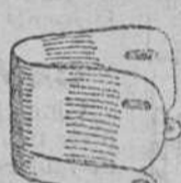
Puños piqué á 1'75 pls. caucho 1'50 plancha 1