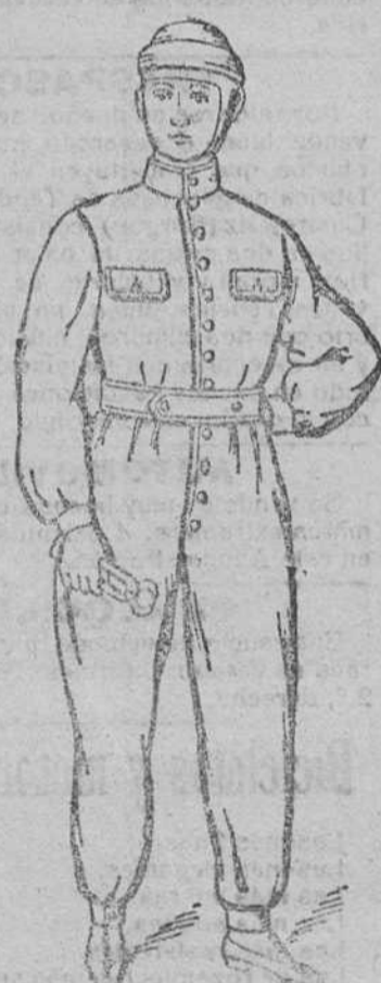
Trajes unidos piqué para mecánicos y listas á 14, 16, 20, 22 y 30 pesetas.