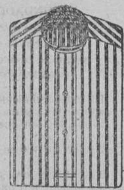
Camisas tirilla en blanco y color, 7, 8, 9 y 10 pesetas.