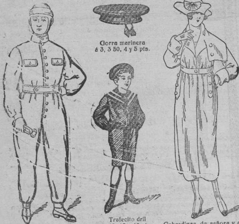
Gorra marinera á 3, 3'50, 4 y 5 pts.

Plaza Mayor, 42, y Lain-Calvo, 9.—Teléfono núm. 88.—Burgos