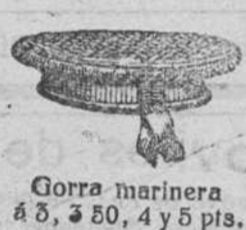
Gorra marinera a 8, 50, 4 y 5 pts.