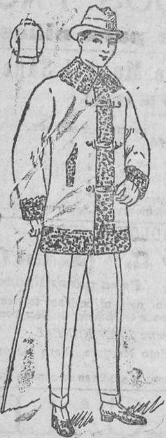
Pellizas carter, con rizo, á 40, 50 y 60 pesetas.