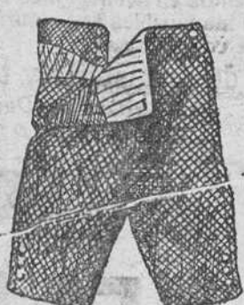
Pantalones peño y pana, á 4, 5, 6, 7, 8, 9 y 10 pts.

Depósito de las sandalias «Paco», con piso de goma, propias para invierno, y de las máquinas de escribir NOISELESS, completamente silenciosas.