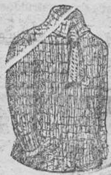
Jerseys lana, á 15, 20, 25 y 30 pts.