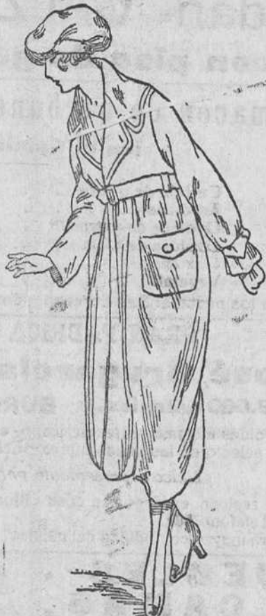
Abrigos para señora, á 15, 20, 30, 40 y 50 pesetas.