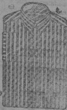
Camisas blancas, bechera piqué, á 8, 9, 10 y 12 pias.