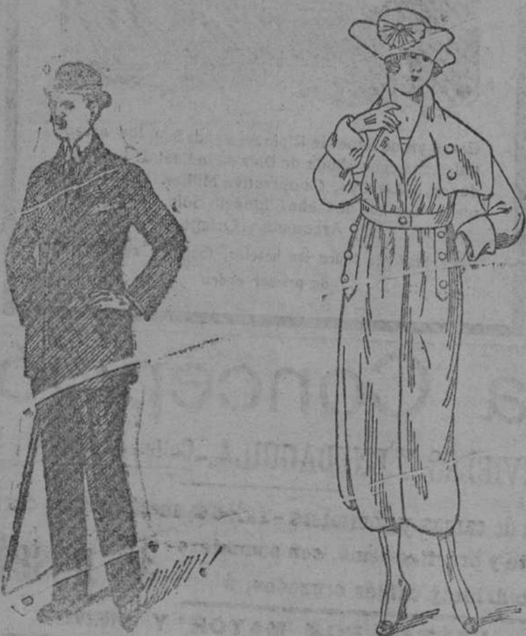
Trajes de paño melton á 45, 50, 60, 70 y 80 pesetas.