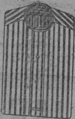
Camisas tirilla, blanco y color, á 8, 9, 10 y 11 pias.

Depósito de las sandalias «Paco», con piso de goma, propias para invierno, y de las máquinas de escribir NOISELESS, completamente silenciosas.