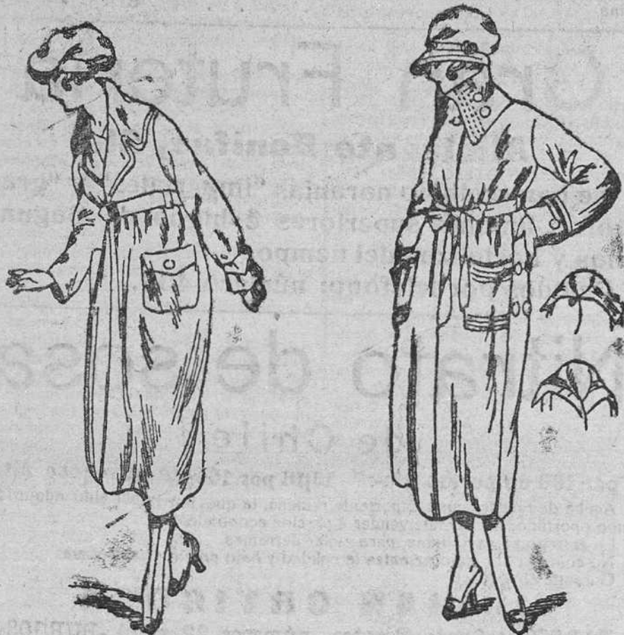
Los nuevos modelos en Impermeables de señora, en negro y color, desde 35, 40, 50, 60 y 75 pesetas.

Plaza Mayor, 42, y Lain-Calvo, 9.-Teléfono núm. 88.-Burgos