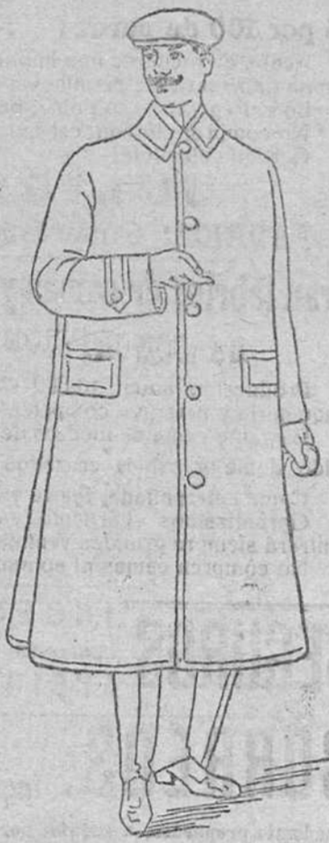
Impermeable caballero, á 45, 50, 60, 80, 90 y 115 pesetas.