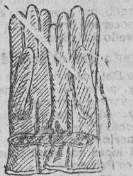
Guantes piel con forro lana, á 10, 15, 20 y 25 pesetas.

Depósito de las sandalias «Paco», con piso de goma, propiamente para invierno. Y de las máquinas de escribir NOISELESS, completamente silenciosas.