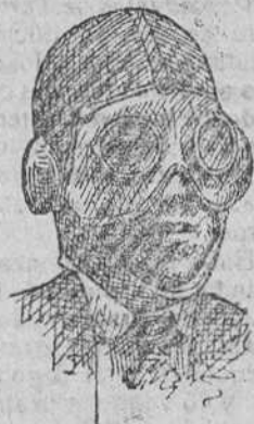
Cascos para motoristas á 5 pts. Gafas, 5 50