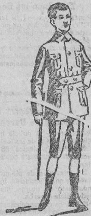
Trejecitos paño, forma sport, á 25, 30, 35 y 40 pts.