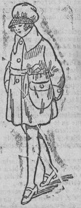
Abrigos paño para niñas, á 12, 15, 20 y 25 pts.