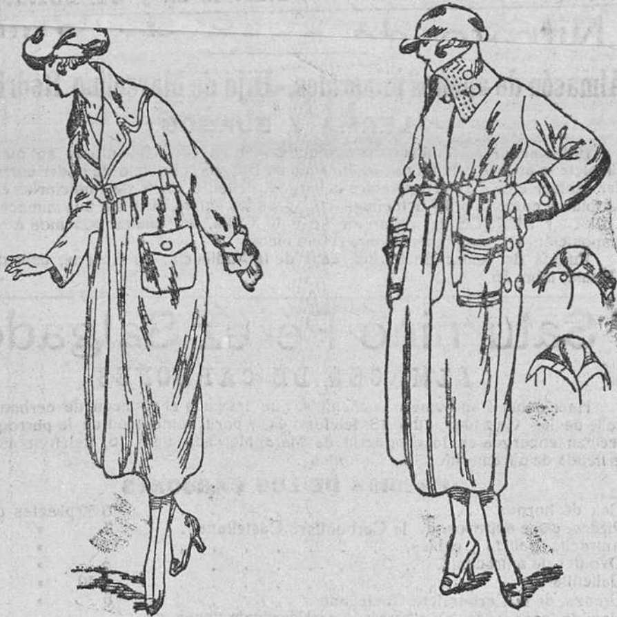
Dos nuevos modelos en impermeables de señora, en negro y color, desde 35, 40, 50, 60 y 75 pesetas.

Plaza Mayor, 42, y Lain-Calvo, 9.-Teléfono núm. 88.-Burgos