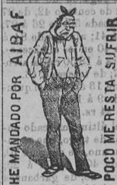
HE MANDADO POR AIBAF