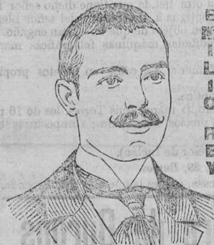
Barcelona 20 de Abril de 1901.

Su admirable preparación Emulsión Scott me ha salvado la vida. Varios médicos me habían declarado físico, tuberculoso, tal era el estado de mi salud desesperado, cuanto inútiles los remedios que hacía.