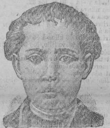
A los 15 días de tratamiento.