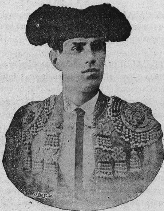
Cayetano Leal y Casado ( Pepe-Hillo ).

maneció hasta Febrero de 1892, que embarcó con rumbo á España.