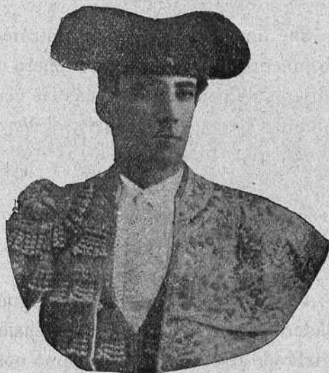
Antonio Reverte y Jiménez

REVERTE JIMENEZ, ANTONIO.—Matador de toros. Nació en Alcalá del Río el 28 de Abril de 1870. Su padre era conocedor de una ganadería brava, y esto sirvió al muchacho para familiarizarse con los toros, los que manejaba