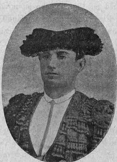
Rafael Molina y Sánchez ( Lagartijo ).

beza de los toreros de la segunda mitad del corriente siglo; su historia, como hemos ya dicho, será una de las más brillantes páginas que ostentará el libro de las grandes figuras de la tauromaquia; en él son contados los que pueden contar tantos años como él de continua lucha con los toros, sin que ni los años ni las fatigas hayan hecho de-