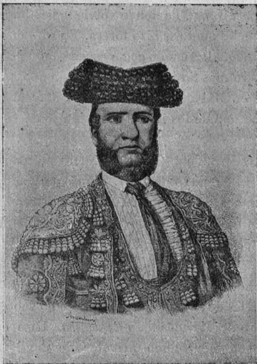
José Dámaso Rodríguez y Rodríguez ( Pepete ).

de 1824. Traficó en ganado con sus padres. Se dedicó á torear en 1845. Después de banderillar durante tres ó cuatro años, se dedicó á matar toros. Alternó en Sevilla con Juan Lucas Blanco en 1850, y en Madrid le fué confirmada la suprema investidura por Curro Cúchares el 4 de Julio