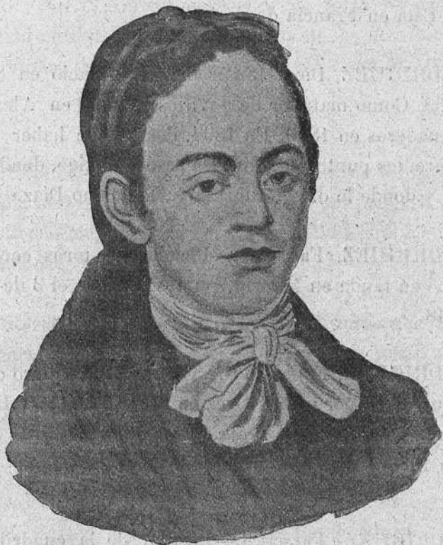
Joaquín Rodríguez ( Costillares )

RODRIGUEZ, JOAQUÍN ( Costillares ).—(Véase su biografía en la página 965 de este segundo tomo.)