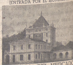
SUCURSAL DEL MERCADO DE GANADOS DE S. AMARO