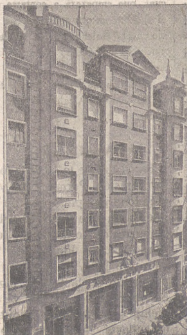
OFICINAS CENTRALES MIRANDA, 5 (Frente a la Estación de Autobuses)