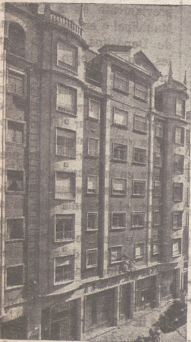
OFICINAS CENTRALES MIRANDA, 5 (Frente a la Estación de Autobuses)