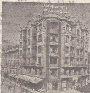
SUCURSAL - Espolón, 32 (ENTRADA POR EL HONDILO)