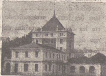
SUCURSAL DEL MERCADO DE GANADOS DE S. AMARO