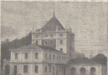
SUCURSAL DEL MERCADO DE GANADOS DE S. AMARO