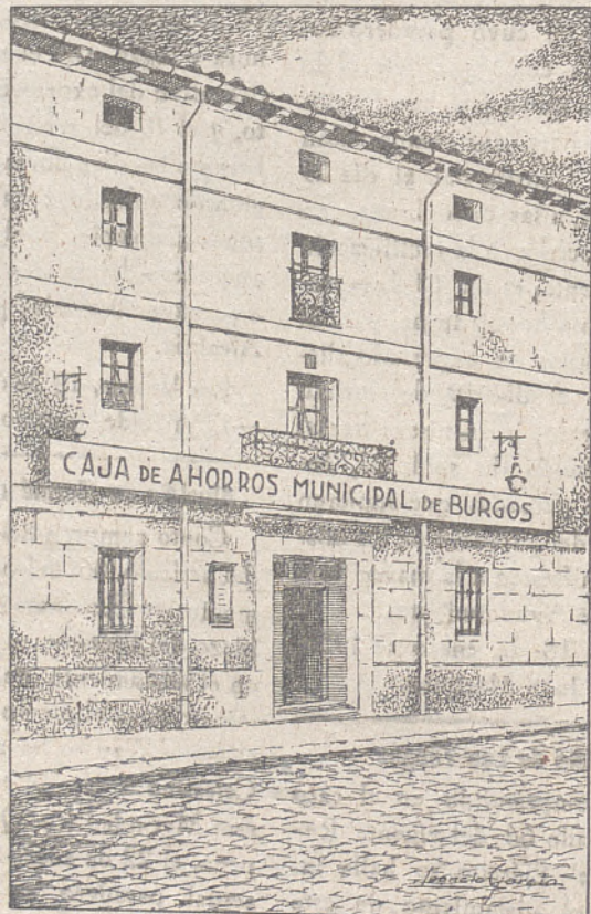
Oficina donde está instalada la Caja de Ahorros Municipal, en Monasterio de Rodilla