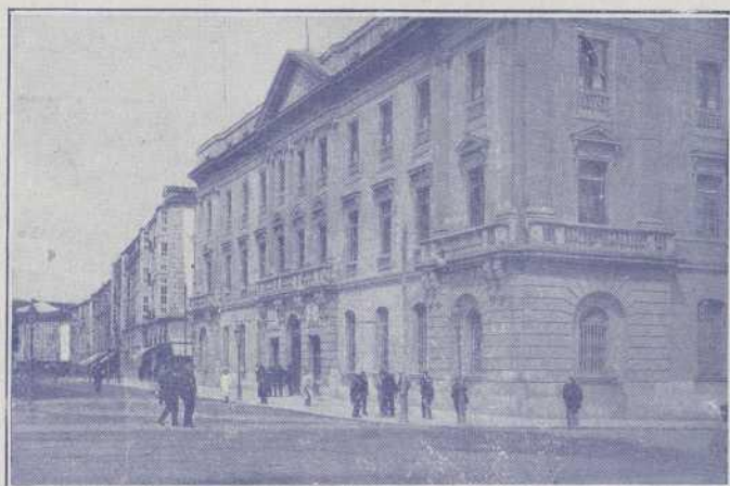
BURGOS: Palacio de la Diputación.