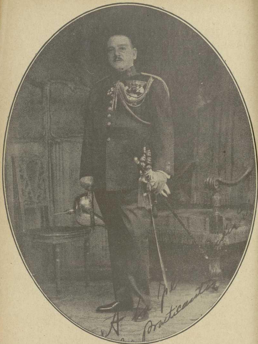
Excmo. Sr. D. Severiano Martínez Anido, Ministro de la Gobernación, gran legislador en materia sanitaria