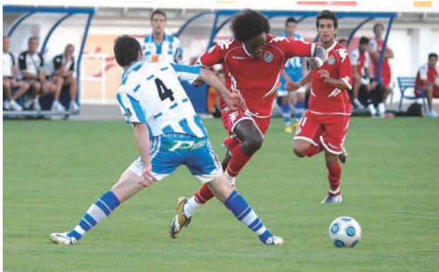
Fotos correspondientes al partido de Arandina - Real Valladolid