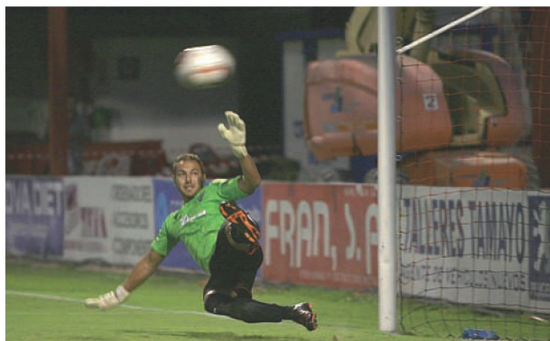
Fotos correspondientes al partido del Mirandés y Numancia