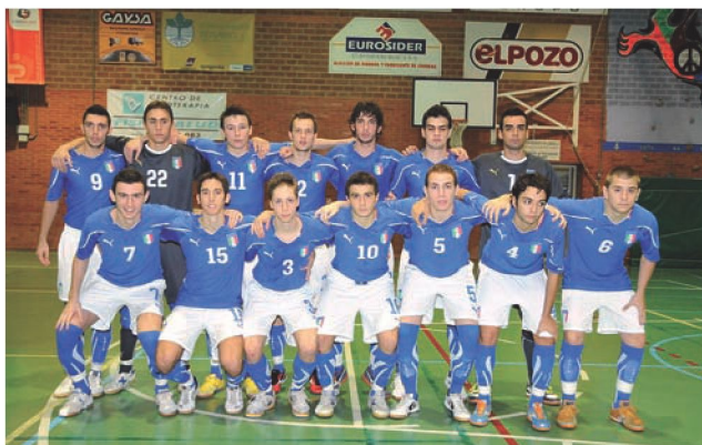
Fotos correspondientes a los partidos de la Selección Sub21 frente a Italia

El conjunto nacional disputó en 2008 el primer Campeonato de Europa de la categoría en Rusia. Lo que antes se hacía llamar, el prestigioso Torneo de San Petersburgo. En esa primera edición como Campeonato de Europa, España consiguió un tercer puesto por detrás de la campeona Rusia y subcampeona Italia. En esa expedición es-