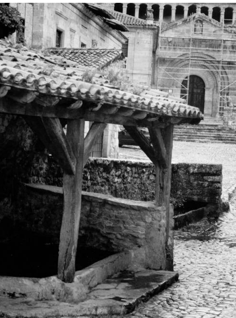
En otros casos, la estructura tradicional se ha conservado tal cual, dentro de un importante conjunto que atrae la curiosidad de turistas y visitantes. Lavadero en Santillana del Mar (Cantabria).

Cuando ya tenían la ropa sucia en su casa, por la mañana temprano cogían la taja de lavar, el trozo de jabón que habían hecho ellas mismas, unas madreñas, la almohadilla para las rodillas hecha de lana, un buen delantal para no mojarse la barriga, un pañuelo