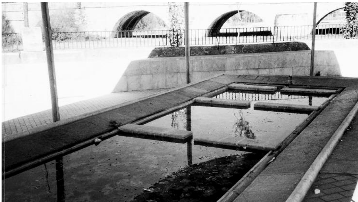
En algunos lugares los lavaderos se han recobrado como elemento decorativo en un intento de convertirse en un homenaje a quienes tuvieron que realizar labor tan dura. Es el caso del lavadero de Puente Castro.

La lavandera era una mujer que se dedicaba a lavar la ropa sucia a unos señores de un estatus social más alto. Me estoy refiriendo a un tiempo ya pasado, como poco sesenta o setenta años, y aunque no puedo hablar con exactitud de años y fechas sí sé que existieron y han quedado en el recuerdo de muchos mayores.