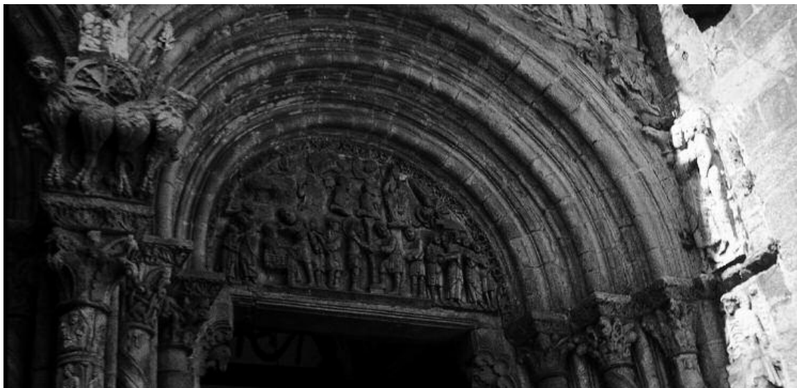
La Puerta de Platerías en la Catedral de Santiago, una de las más antiguas que se conservan en este lugar de culto y referencia para tantos peregrinos a lo largo de los siglos.