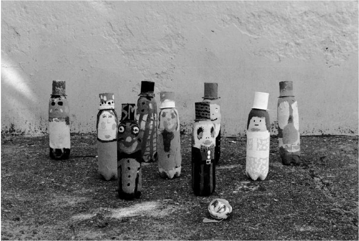
Actualmente, muchos momentos tratan de recuperar estos y otros juegos tradicionales. En la ilustración, recreación de un juego de bolos a partir de materiales reutilizados.