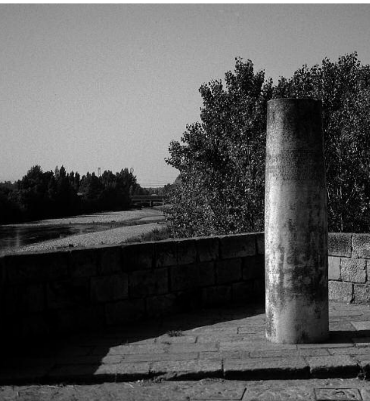
Columnas que, marcan sobre el Puente de Órbigo el hito del Paso Honroso

Aquí renacen en la joven las ganas de vivir, entusiasmada y acompañada de otras personas en la humanitaria labor. Un río de