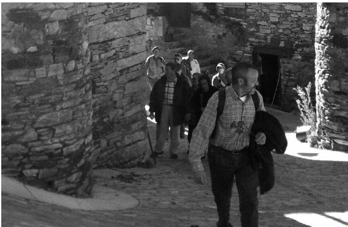
Caminar es uno de los mejores ejercicios que podemos hacer a cualquier edad, como nos lo demuestran estos compañeros del grupo de Senderismo de los Centros León I y II, además de contar con el aliciente de disfrutar del paisaje y conocer nuevos lugares.

Es una necesidad saber equilibrar las actividades que hagamos con el reposo, de lo contrario se produce un trastorno del sueño que hay que solucionar con un programa equilibrado de actividades de la vida diaria. Esto soluciona el exceso de sueño durante el día que, además de inoportuno, condiciona el que la persona mayor esté por la noche despierto e inquieto.