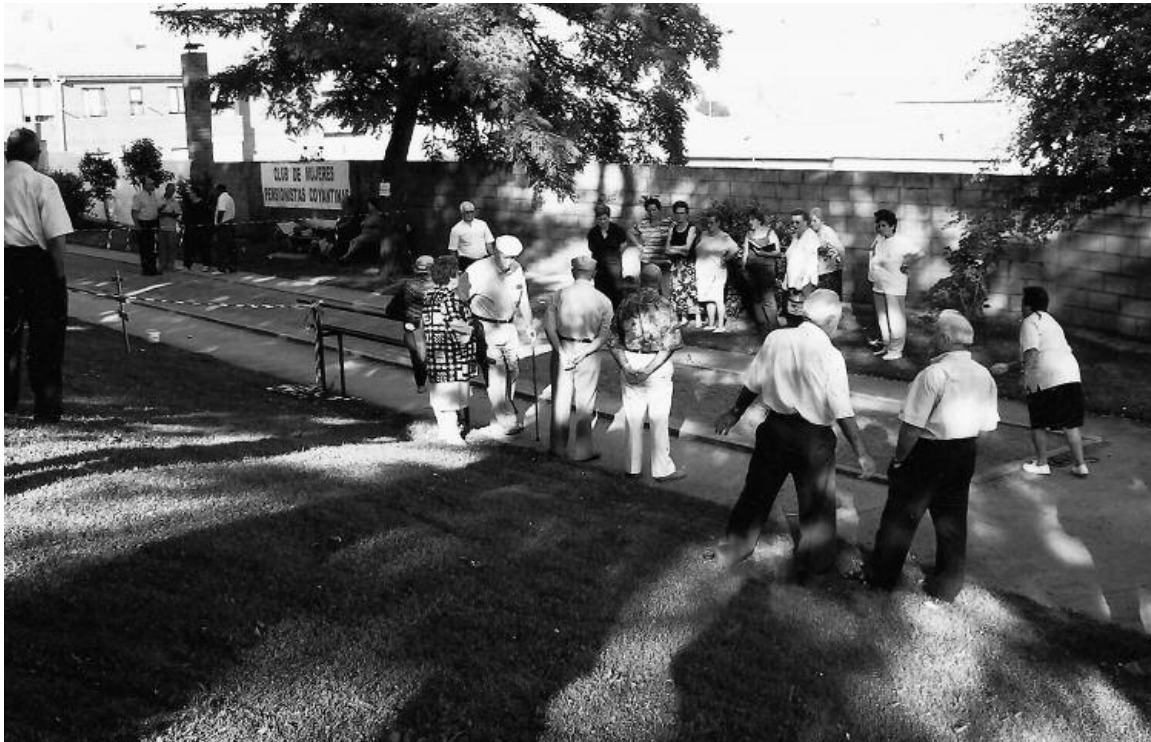
Cada vez más hombres y mujeres "mayores" se acercan a los juegos tradicionales. Como decíamos, es otra forma agradable de practicar un ejercicio físico equilibrado.

Para que vivas más, dando vida a los años.