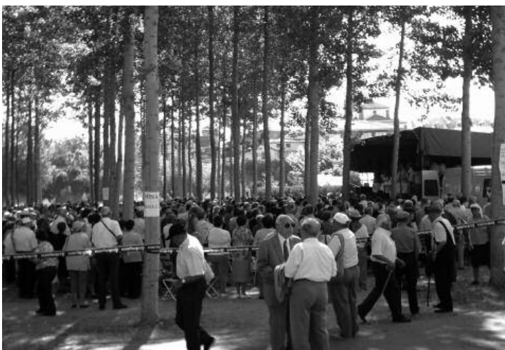
La campa de Hospital de Órbigo en plena apoteosis de participación.

cuanto algunas deficiencias que pudieron observarse. En primer término la insuficiente capacidad del lugar donde se colocó el altar y que también se empleó para la entrega de trofeos. En segundo lugar el suelo de la campa por la mañana no estaba regado y sí lleno de hojas secas de chopo, con lo que durante todo este tiempo se levantó un polvo muy molesto.