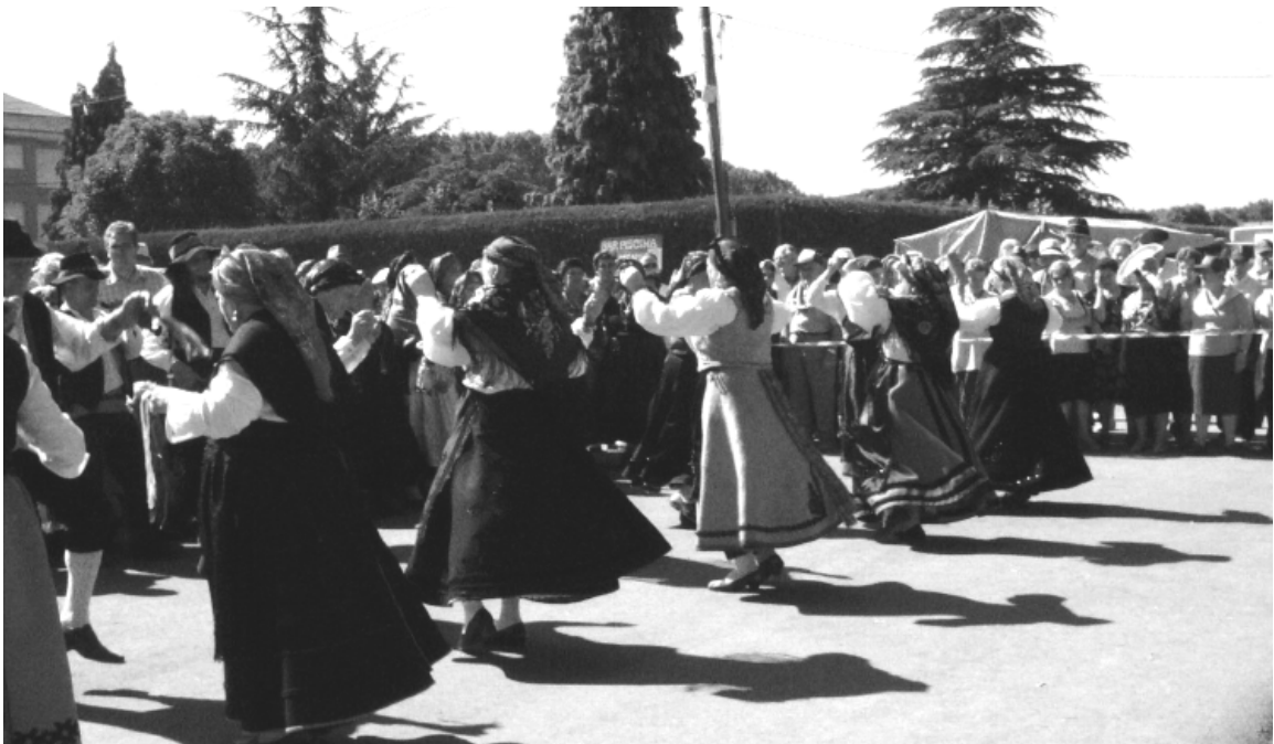
Grupo de bailes regionales en un momento de su demostración.

Comentario aparte merecen algunos aspectos negativos recogidos de las quejas surgidas entre el público asistente en