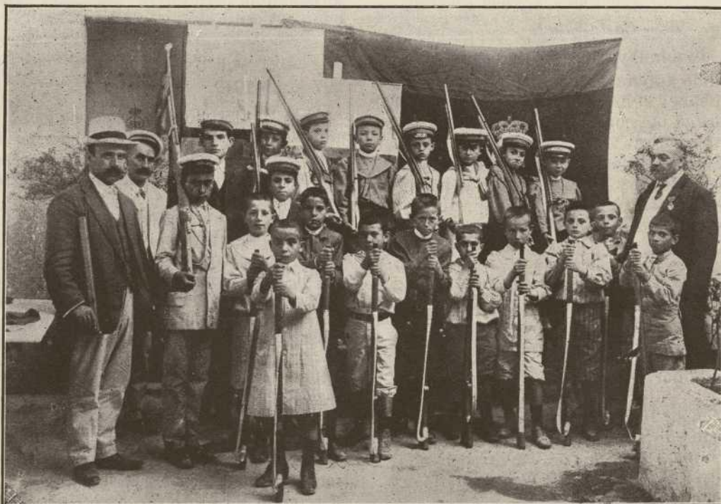
Grupo que forma parte de la sección escolar militar de la 1. a Escuela nacional de niños de Lluchmayor, cuyos fusiles, aunque de madera, parecen naturales.