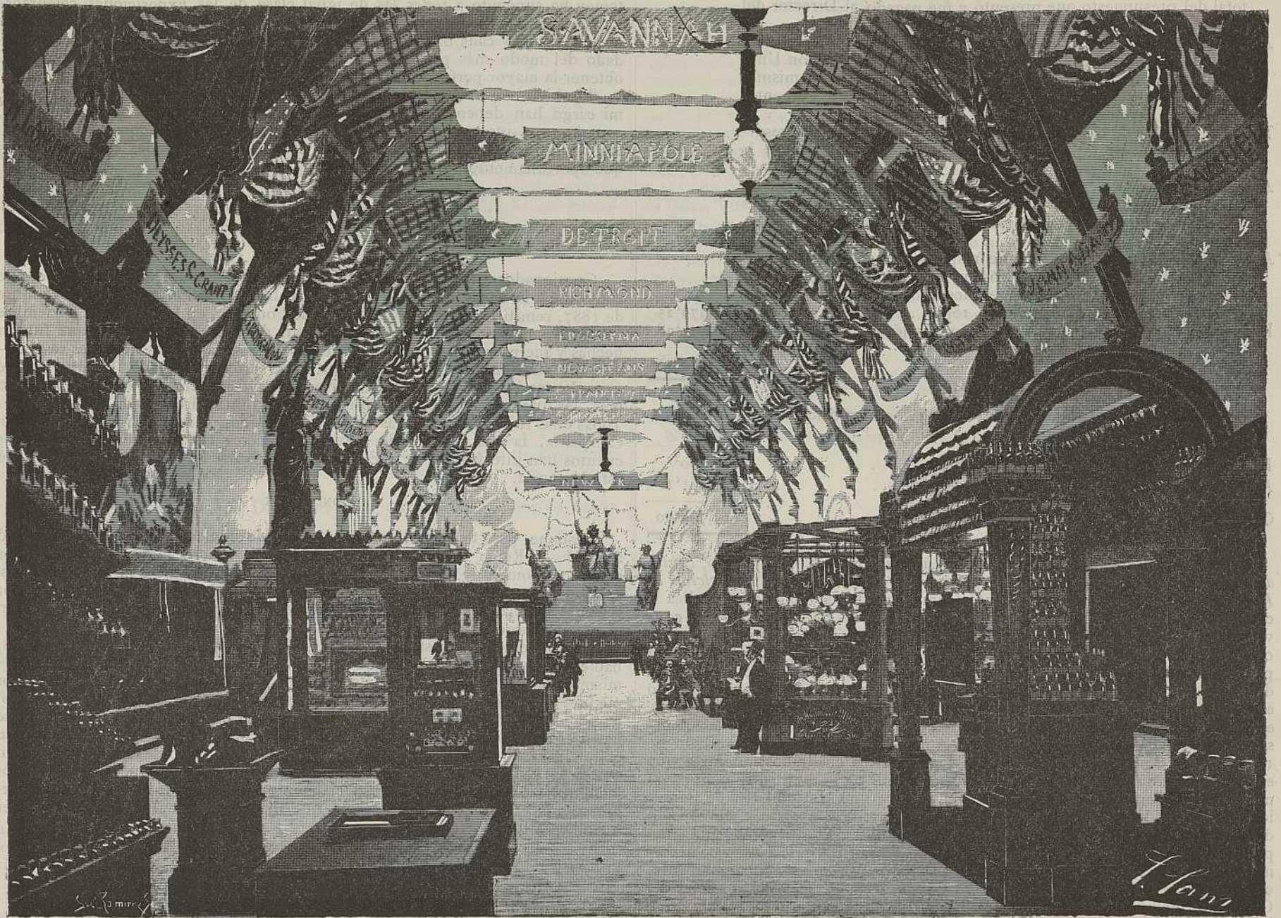
NAVE CORRESPONDIENTE Á LOS ESTADOS UNIDOS EN EL GRAN PALACIO DE LA INDUSTRIA

el conde de Espagne, bajo Fernando VII, y que hace pocos meses ha obtenido una fuerte subvención; con todo y fertilizar extensa comarca de Aragón y de la provincia de Lérida, pareciendo de resultado seguro, esta es la hora en que no se han llevado á cabo las obras de terminación. El otro es el Canal de Urgel, que por error ó engaño (y repitió esta palabra) del Ministro de Fomento, fué presupuestado en 32 millones de reales, y al cabo de muchos años de trabajos se gastaron 92 millones de reales.