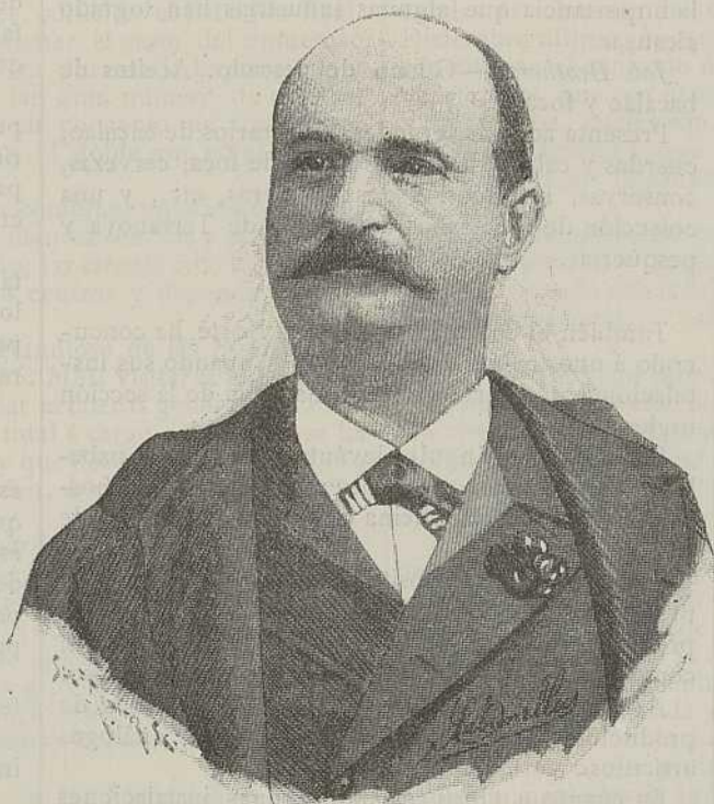
MR. EMILE M. BLUM, COMISARIO DE LOS ESTADOS UNIDOS EN NUESTRA EXPOSICIÓN UNIVERSAL

para dicho Certamen, quien emprendió al punto su activa campaña de propaganda á favor de la Exposición. La falta de tratado de comercio entre España y los Estados Unidos y la falta de comunicaciones directas entre ambos países eran las poderosas razo-