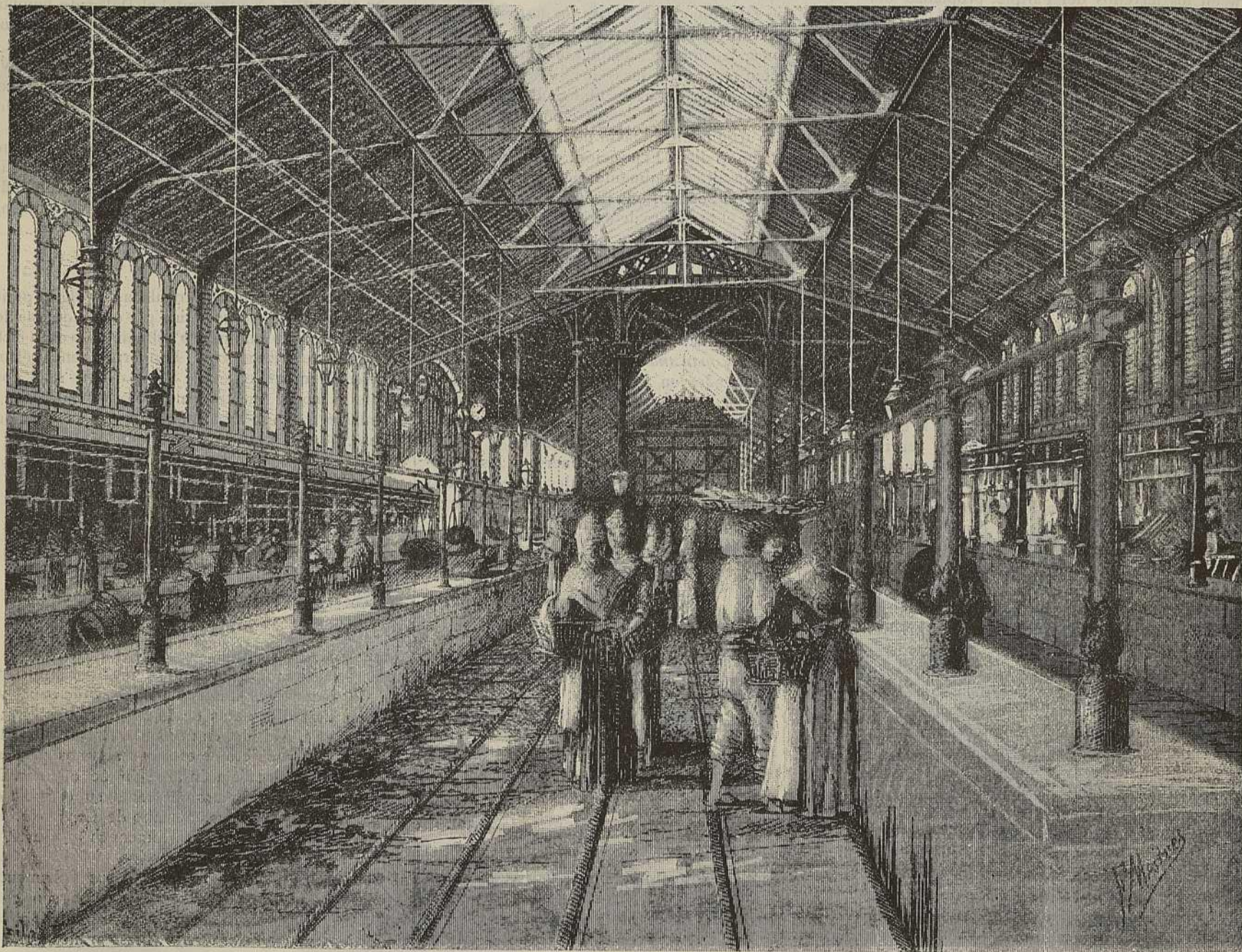
INTERIOR DEL MERCADO DE S. ANTONIO—BARCELONA

«Exposición Universal.—Teniendo que abrirse indefectiblemente la Exposición Universal de Barcelona el 15 de Setiembre próximo, y siendo de imprescindible necesidad que los objetos que á ella se envíen, lleguen allá con alguna anticipación para