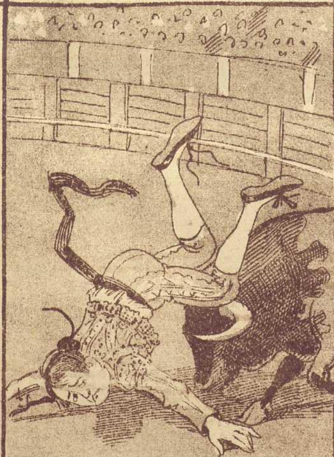
7 Y cuando ya, enfurecido salió el bicho, y la morena á su torero querido vió rodando por la arena.