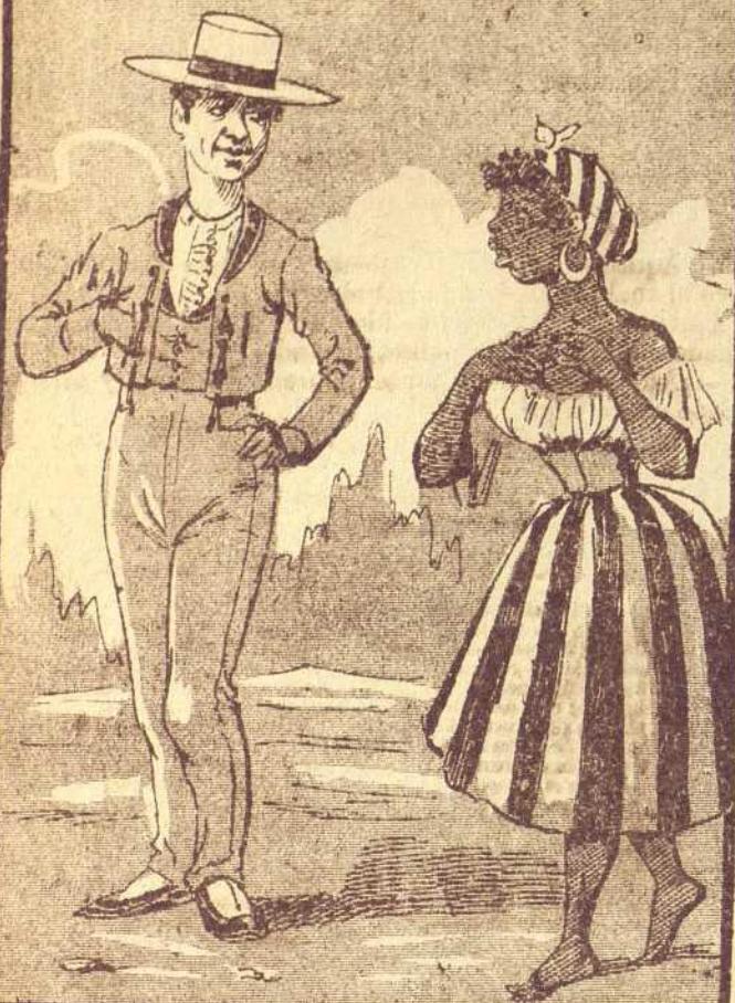
1 Una negrita cubana se enamoró de un torero de los que van á la Habana á trabajar por Enero.