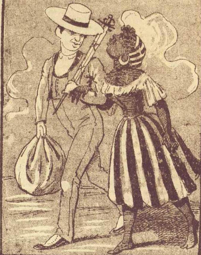
2 Y el tal que era un ñapa de marca mayor con estoques, y trajes y capa se fué con su amor.