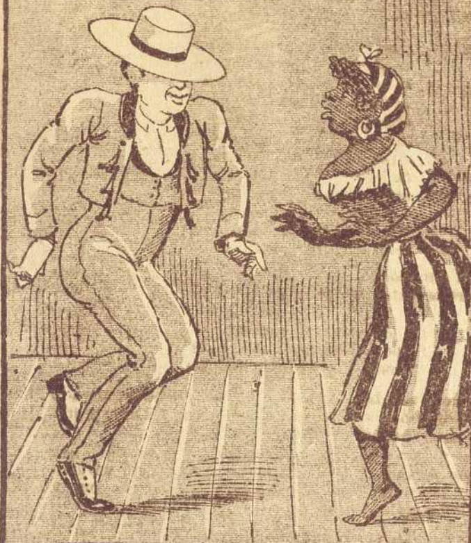
3 Mientras se acercaba el día de matar, el muy zanguango alegre se entretenía bailando con ella el tango.