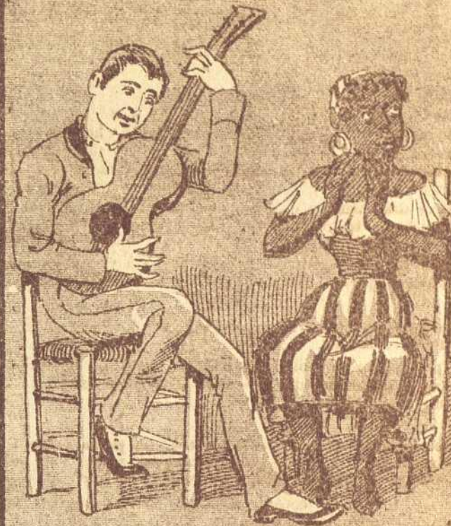
4 Y así que las piernas lograban cansar las guarachas más dulces y tiernas la hacia cantar.