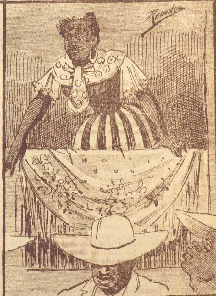
8 A voces y gritos decía ella así: —¡Si será aficionado á tanguitos que los bala aquí!