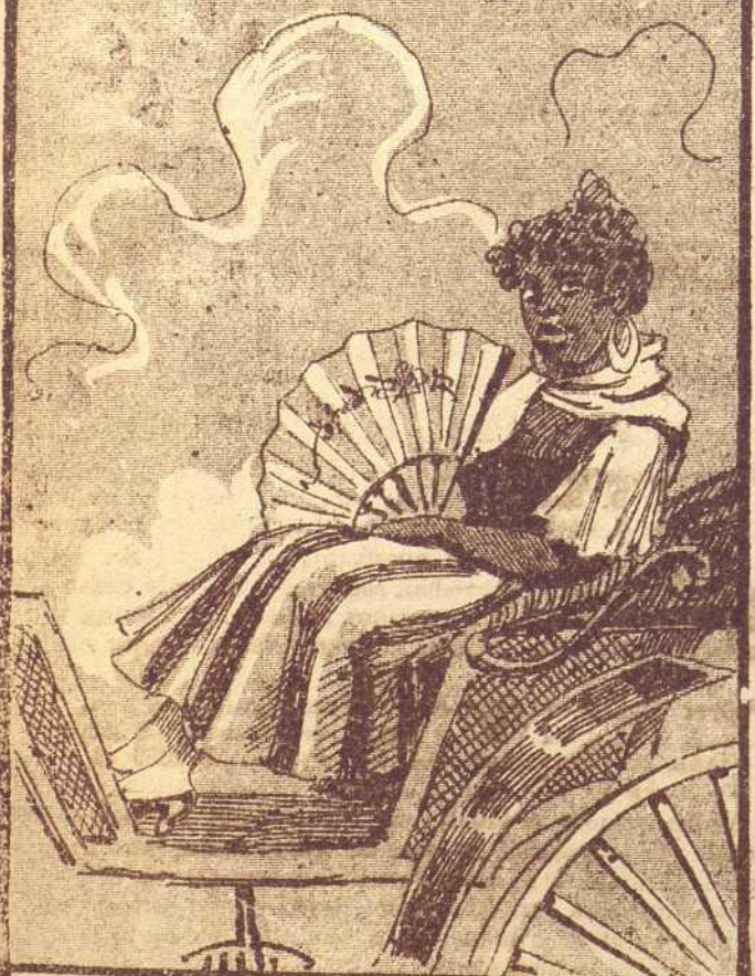
5 La primer tarde de fiesta la negrita , ¡que derroche! muy lujosa y muy compuesta se fué á los toros en coche.