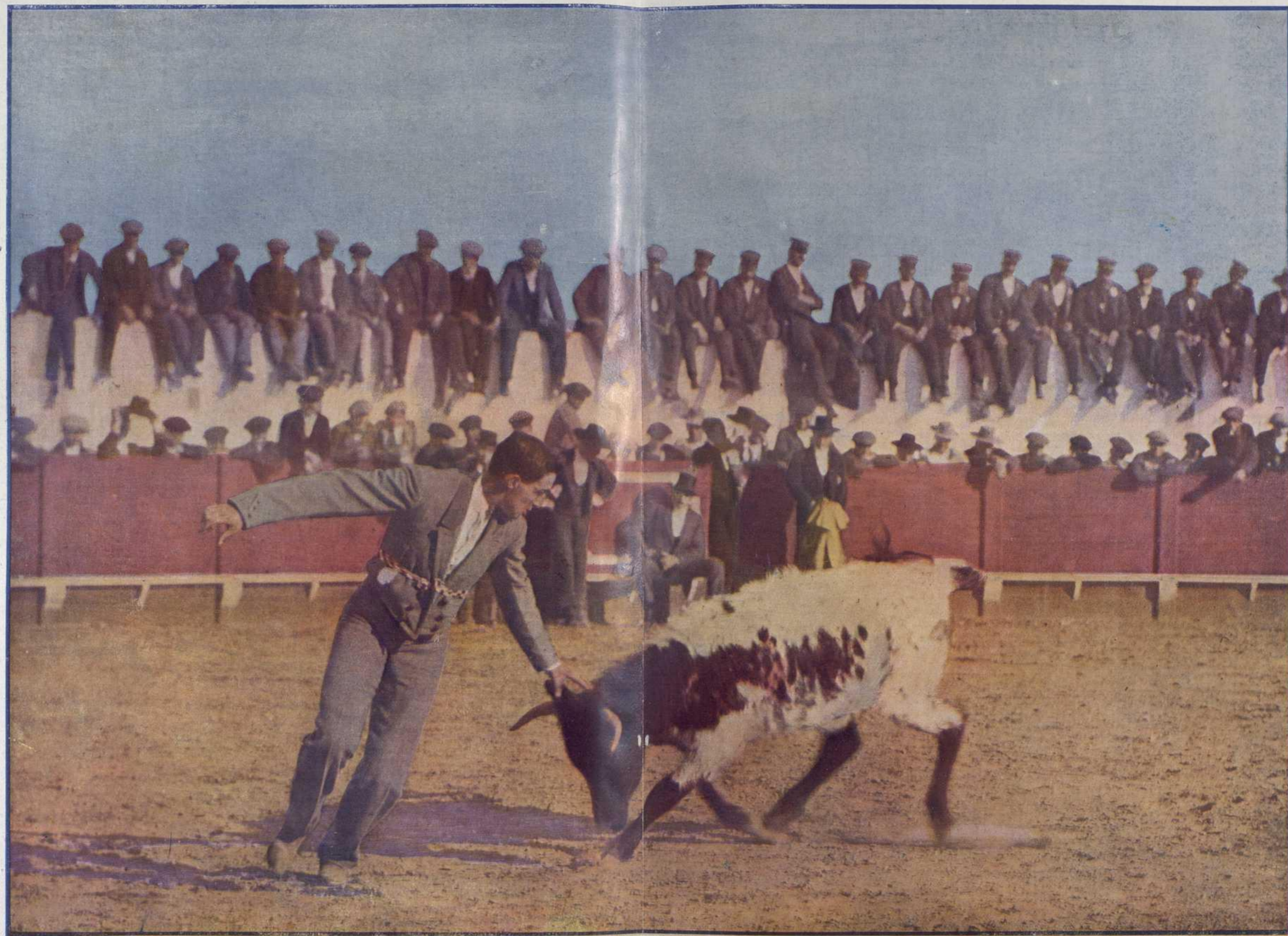
El gran Joselito jugueteando á cuerpo limpio con un becerro.