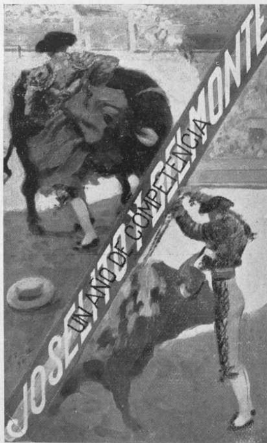
Portada del libro que á primeros del próximo mes se pondrá á la venta.

Consecuencia de esto es que cada año el exceso de producción es mayor y más grande el descontento entre los ganaderos que no venden sus toros.