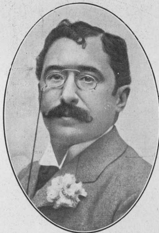
Mariano de Cavia, ilustre periodista, maestro de maestros, á quien le ha sido concedida la Gran Cruz de Alfonso XII.

Con esto, algo hubiera hecho por asegurar la feria de Septiembre.