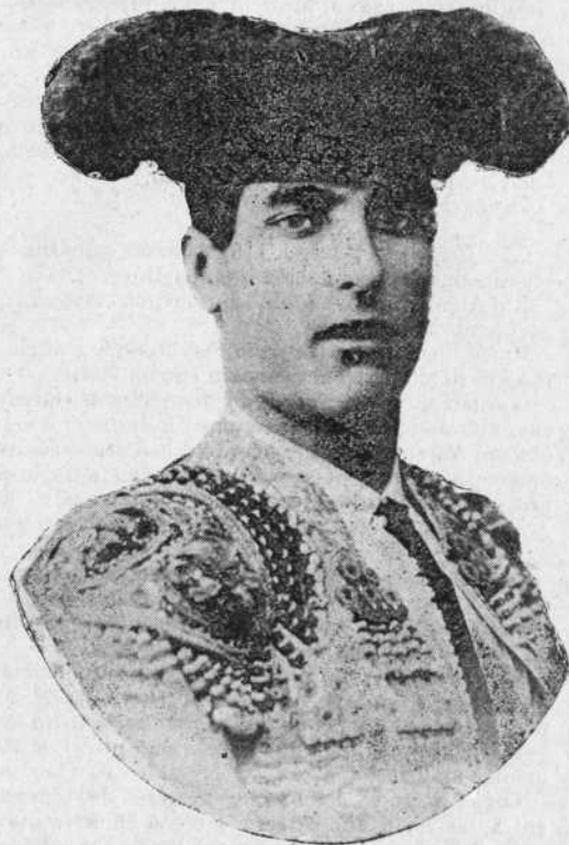
JOSÉ GARCÍA (el ALGABEÑO)

El resultado del trabajo del Algabeño en dicha tarde no fué el que esperaban muchos aficionados; pero, sin embargo, puso de relieve que en el debutante había