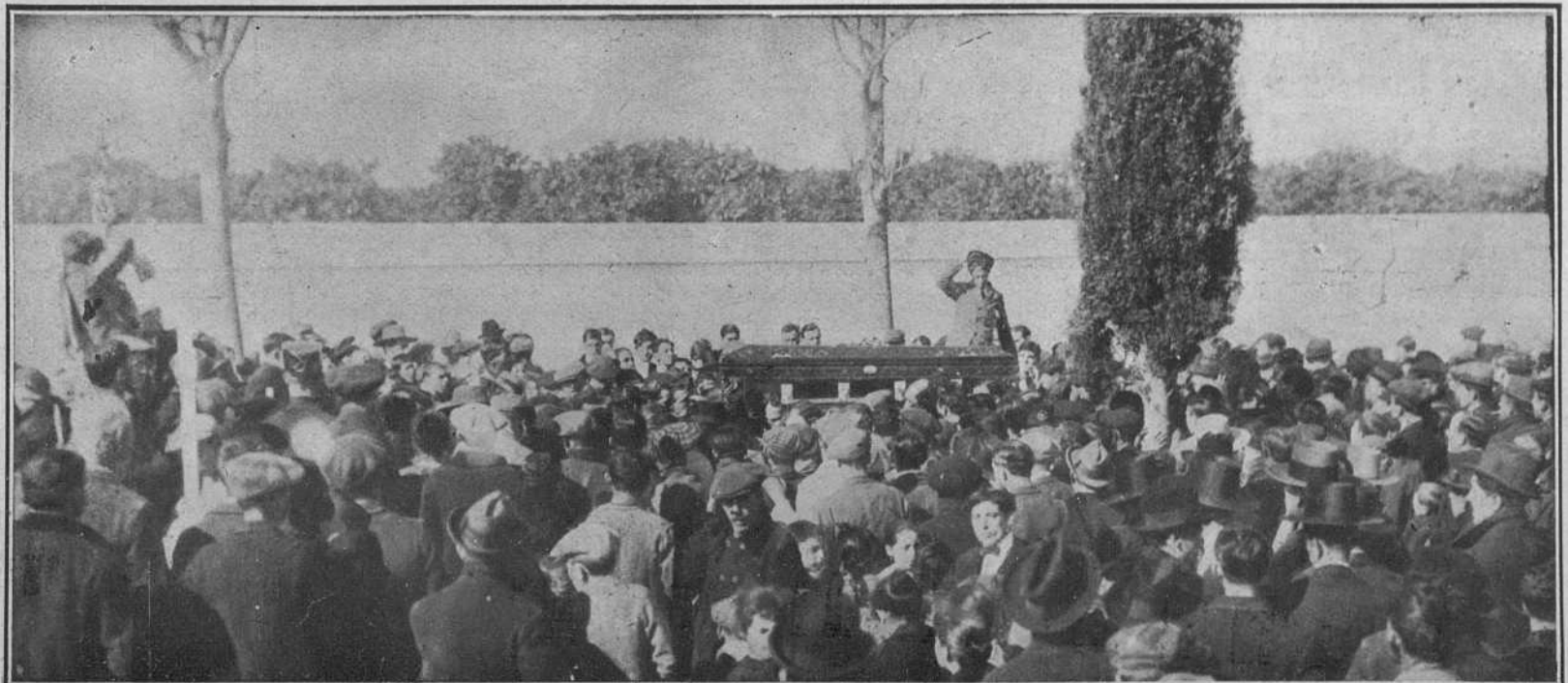
LOS RESTOS DE DOÑA GABRIELA A LA LLEGADA AL CEMENTERIO