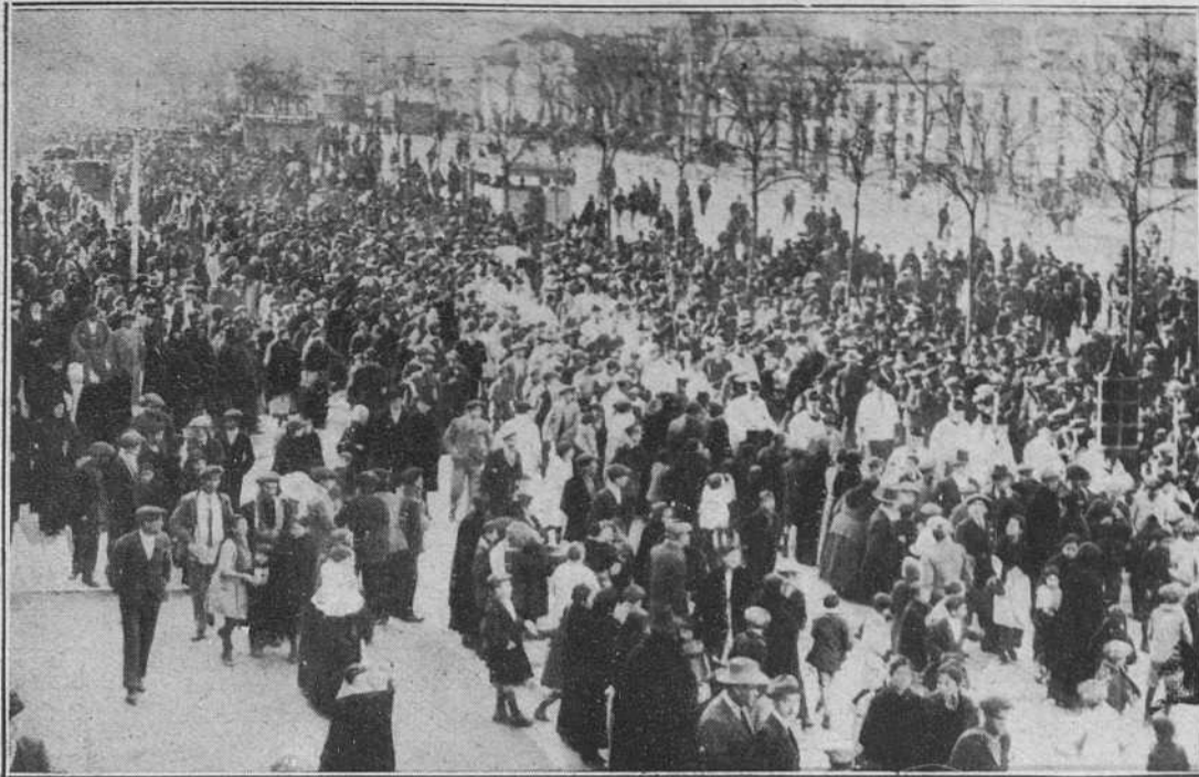
EL ENTIERRO DE LA MADRE DE LOS "GALLOS" AL PASAR POR LA ALHAMEDA DE HÉRCULES

bendecir el momento que dió el ser al último de la dinastía de los Gómez Ortega, y al primero de las figuras contemporáneas del toreo. ¡El genio de la torería!