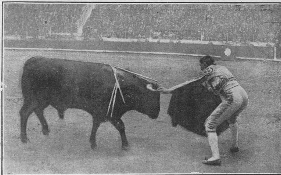
Joselito el 25 en Barcelona.

¡Hay que oír detallar y lamentarse á los que asistieron!