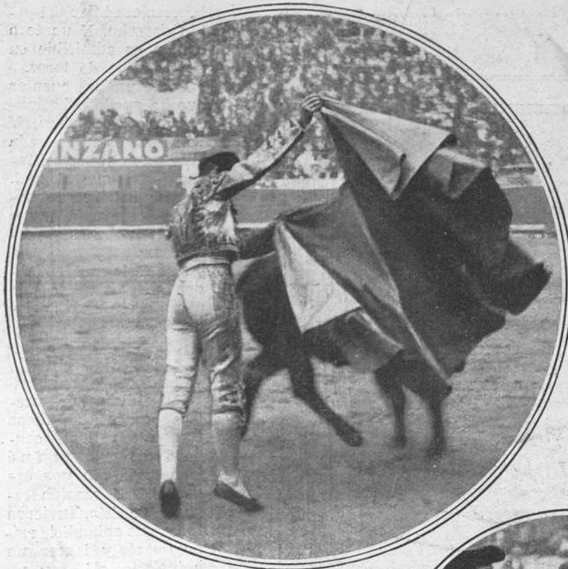
Una verónica de Joselito el 25 en Barcelona.