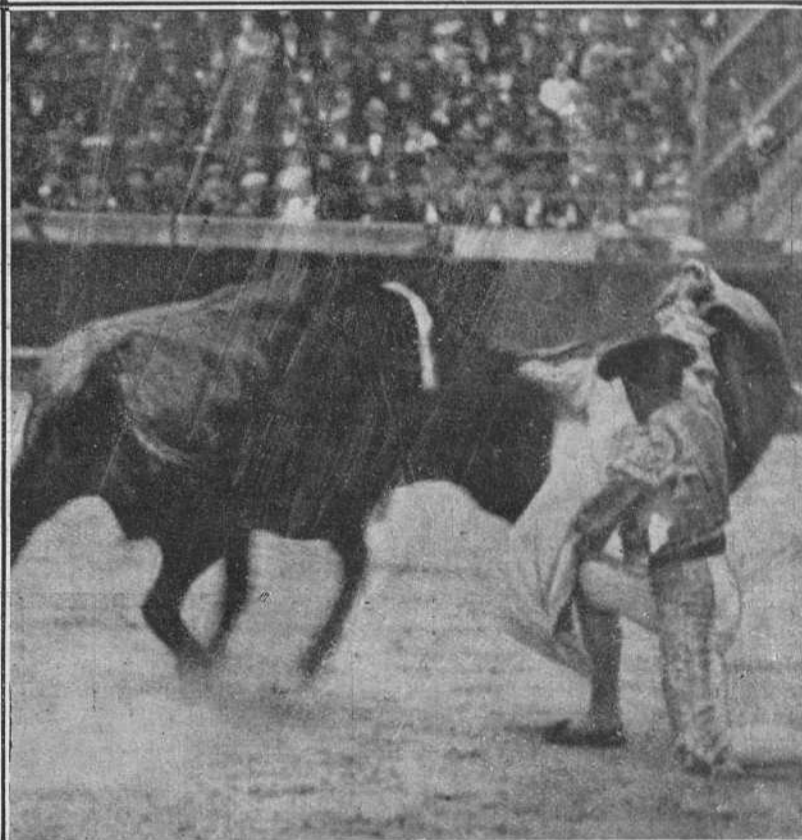
Gaona, Joselito, Belmonte y Ballesteros en la corrida celebrada ayer tarde en la plaza de las Arenas de Barcelona.