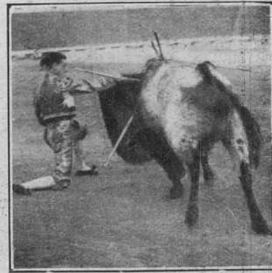
Amuedo pasando de muleta.