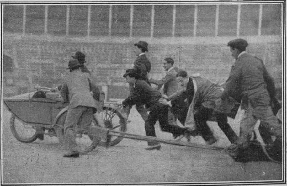
Un arrastre en motocicleta.