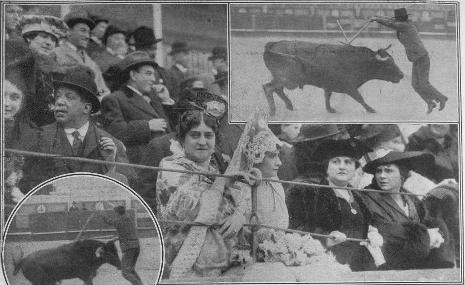
Un aspecto de un tendido de la fiesta celebrada el sábado.