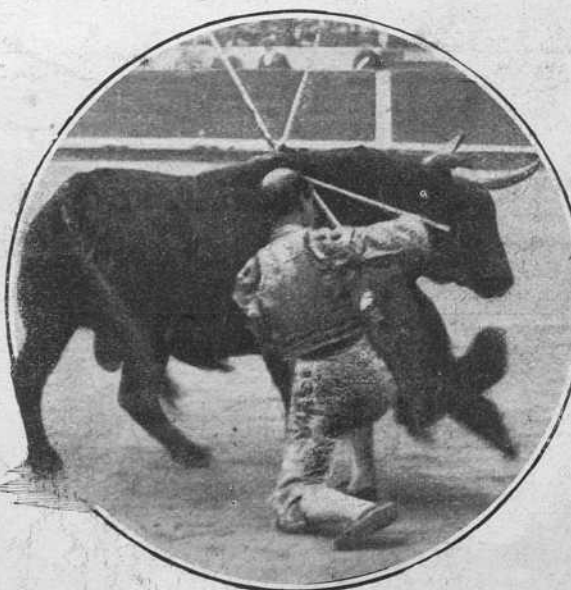
Un pase de Rafael el Gallo.