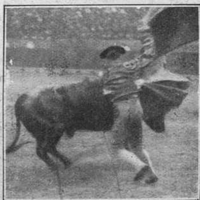
Una verónica de Varelito.