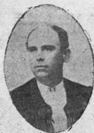
Rafael Guerra (Guerrita) [27 Septiembre 1887 Capuchinos, 10, Córdoba.