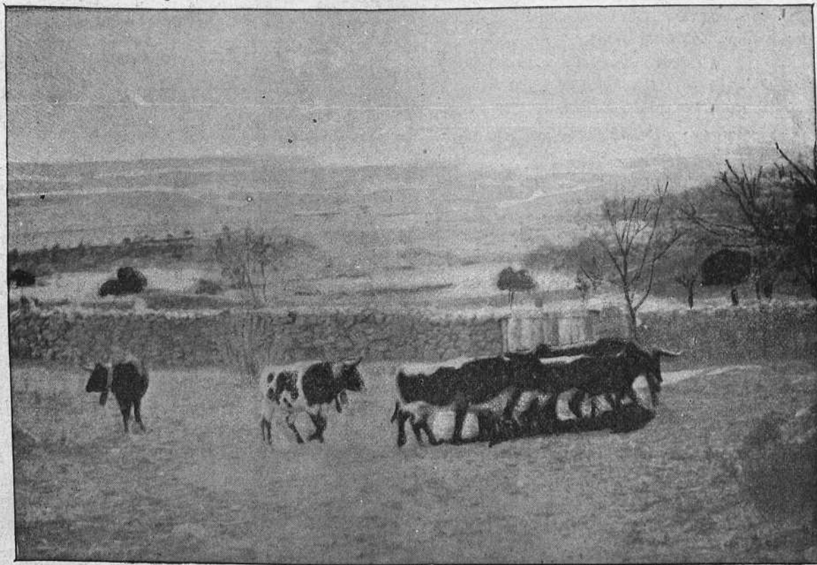
CABESTROS CONDUCIENDO LOS BECERROS AL CORRAL.

sin llegar al fondo ; y tú no has visto caer un picador, ni un caballo al agua, sino aquellos días en que diluvia y los diestros quieren suspender la lidia, y el público dice que no, y el presidente que sí, y por fin llueve y se convierte la corrida en Naumaquia, que al fin es una variedad.