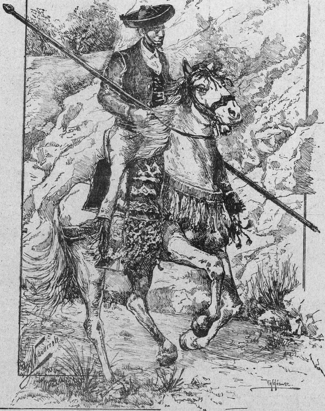
UN VAQUERO.—(Dibujo de Navarrete).