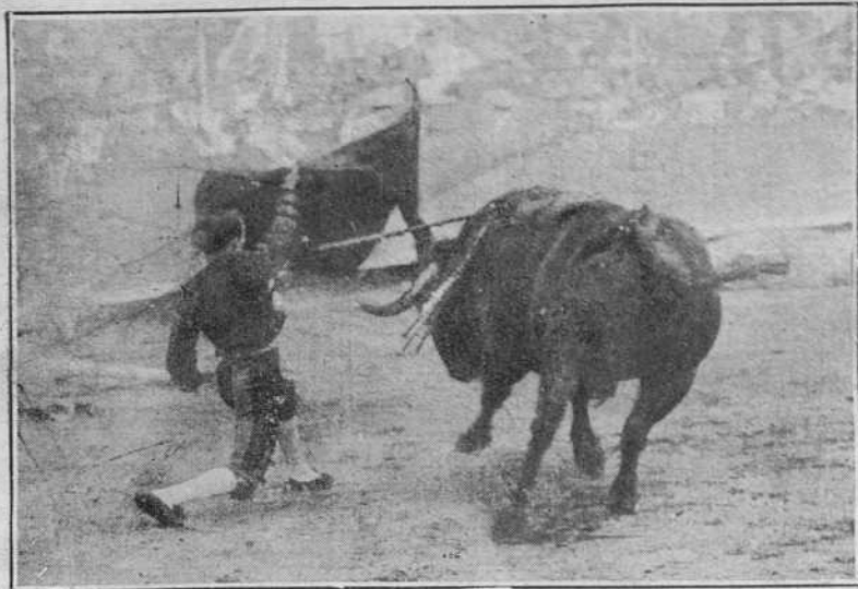
Blanquito el 12 del corriente en Barcelona.