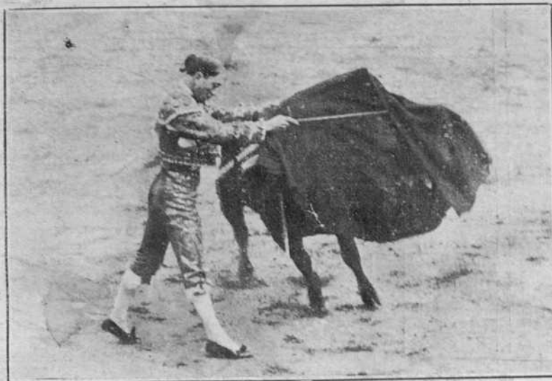
Mora en la misma novillada.