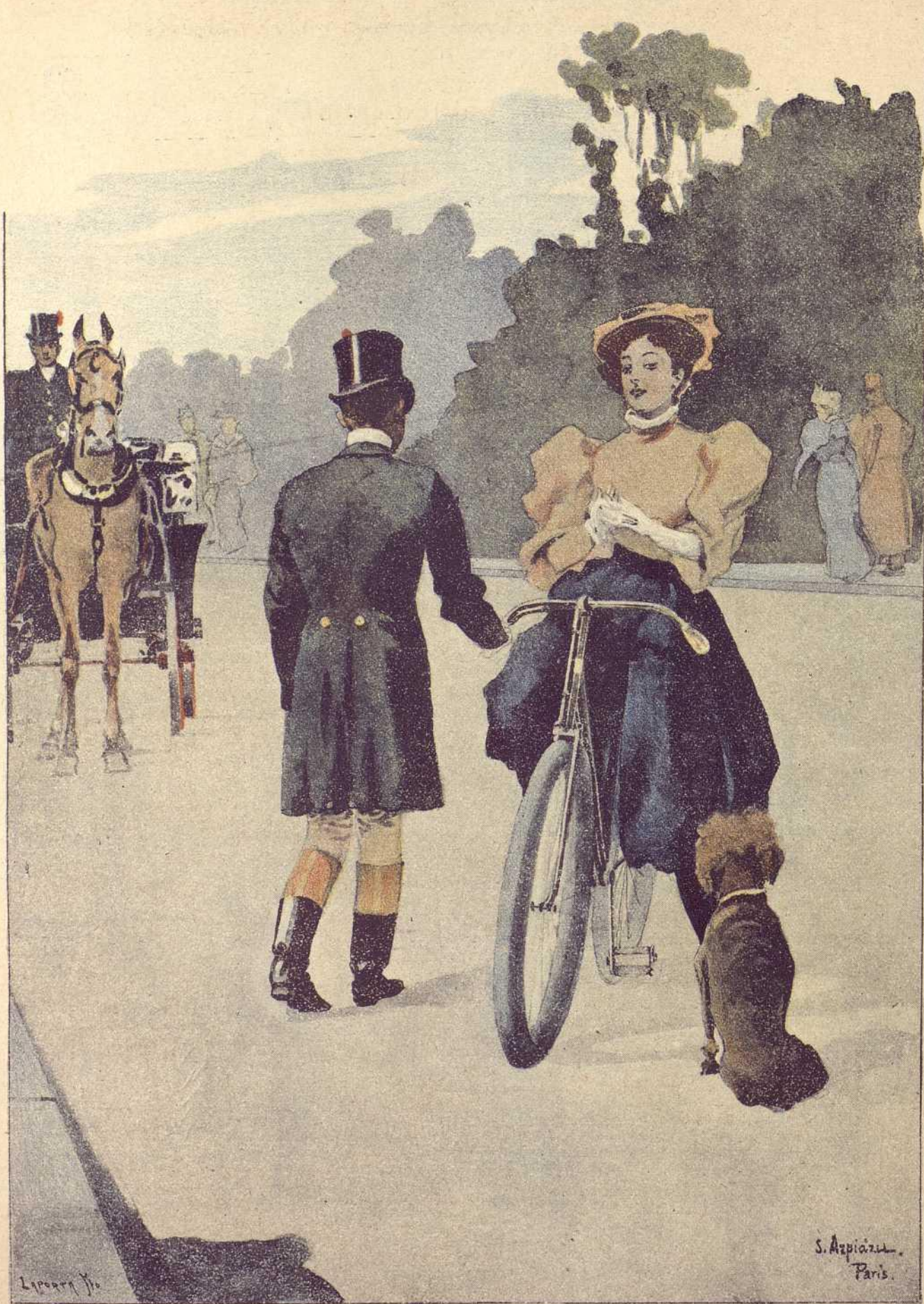
DEPORTE DE MODA