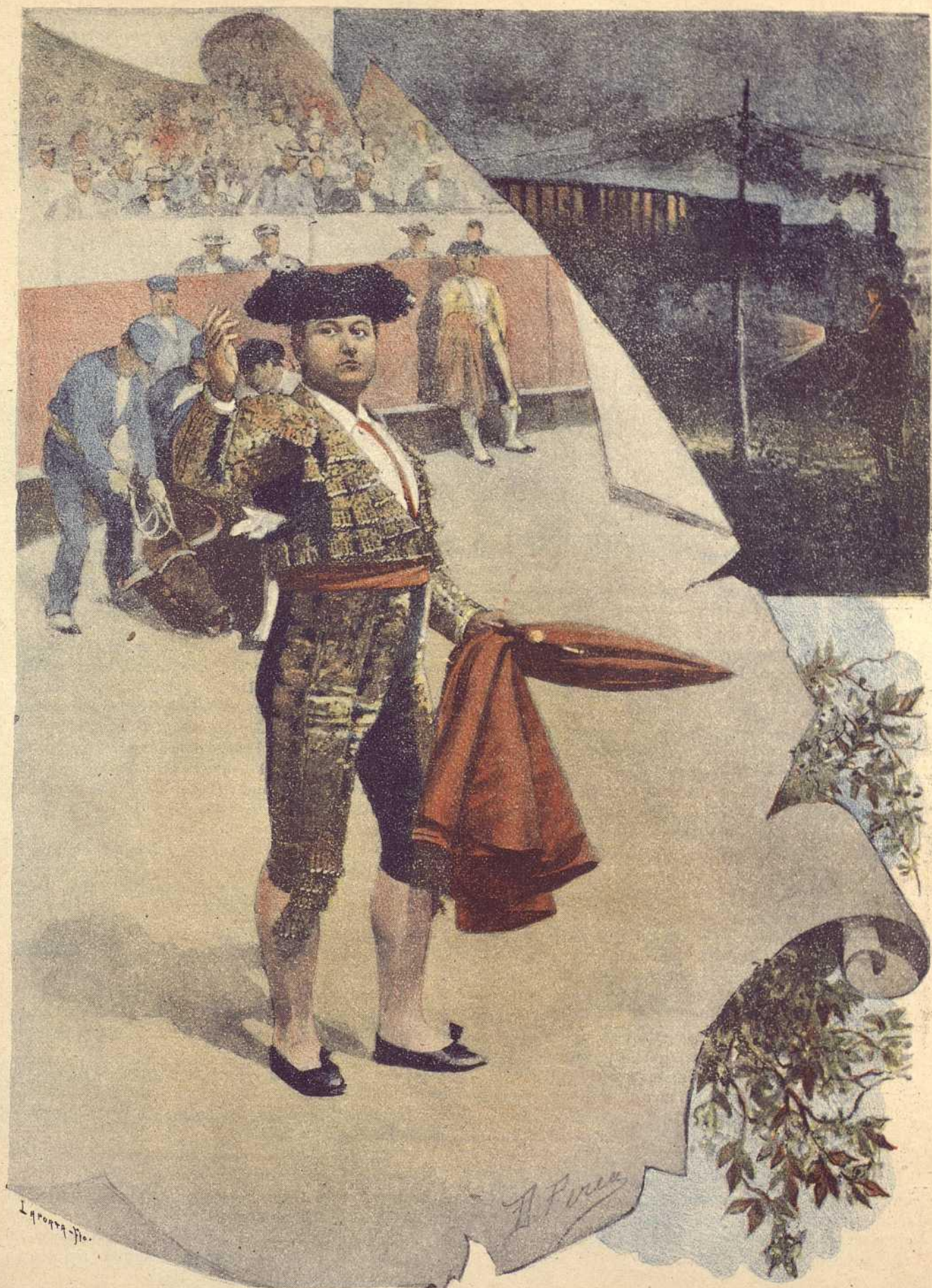
DESPEDIDA DE CARA-ANCHA: SEVILLA 1894