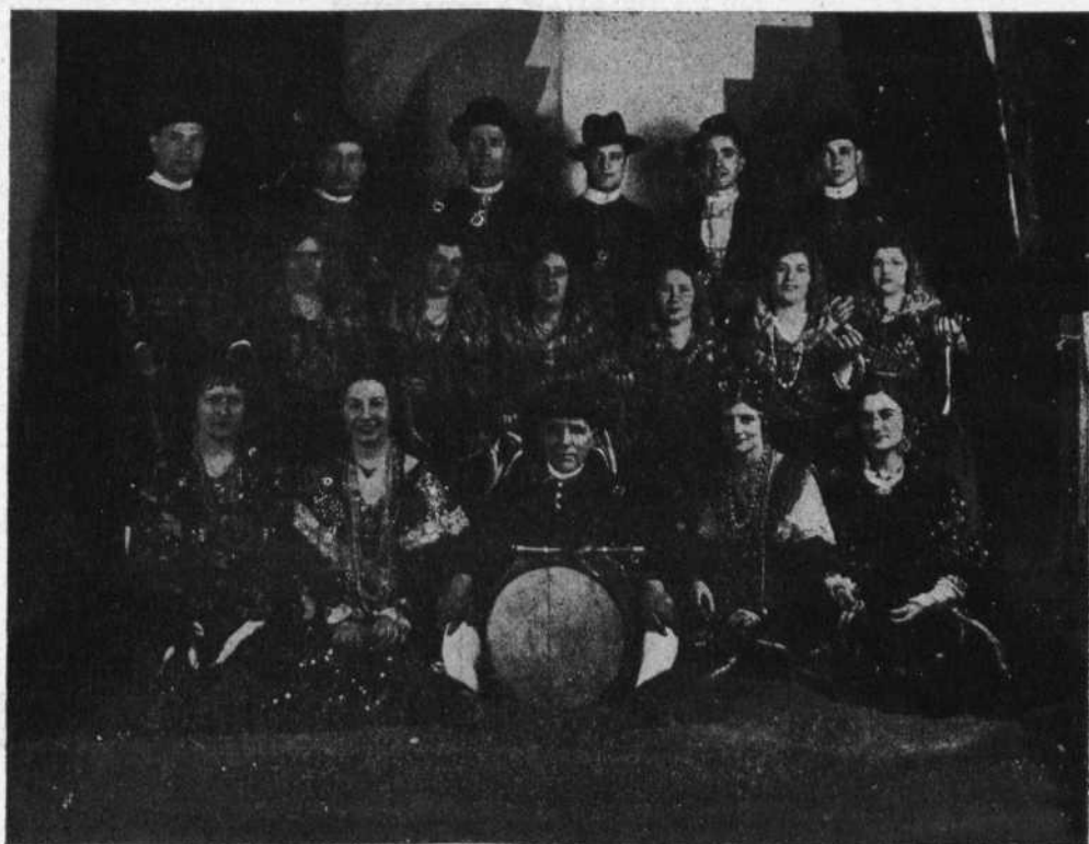
Cuadro representativo de la Región Leonesa

Hecho el silencio después de la atronadora ovación con que se acogieron las palabras del Presidente de España, pronunció un brillante discurso el vicealmirante argentino don Vicente E. Montes, Presidente de la Comisión de Homenaje, durante el cual recordó las inmarcesibles glo-