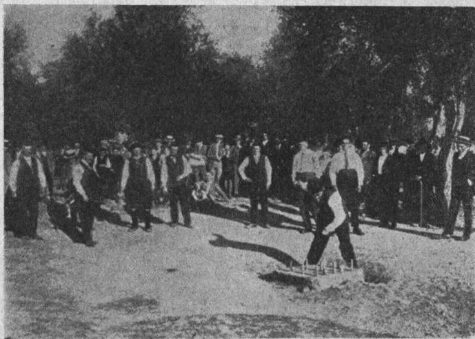
JUGANDO A LOS BOLOS EN TIERRA DE MARAGATOS

Los bailes se celebran todos los domingos y días festivos en un vasto campo o pradera, al compás del tamboril y la dulzaina. Forman grupos distintos las solteras y las casadas. Estas distingúense de las solteras por el «caramiello», el pañuelo a la cabeza, de seda y generalmente a cuadros, y por los calados de las medias.