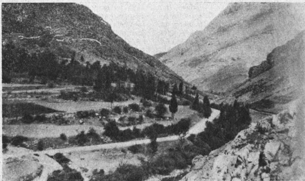
VISTA PANORÁMICA DE NOCEDO (LEÓN)

titas de una majestuosidad verdaderamente fantástica.