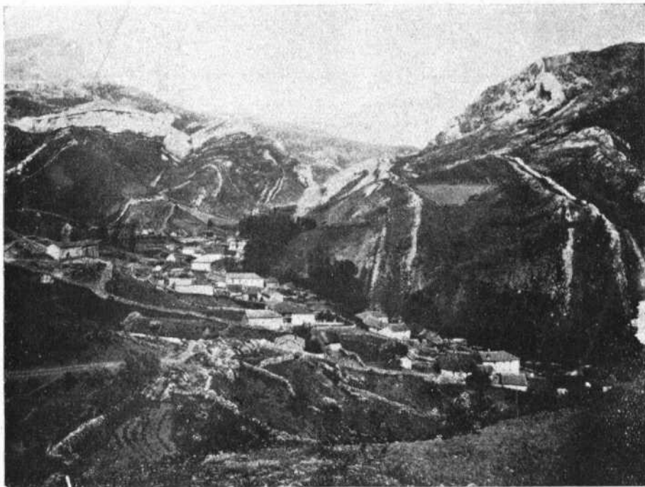
VISTA PANORÁMICA DE PINOS