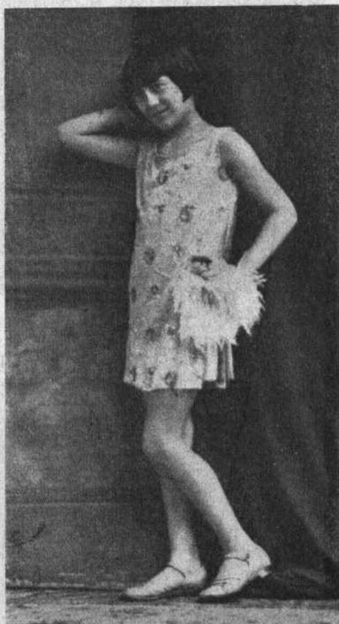
PETIT - IRIS

Son dos fechas tradicionales en nuestra casa; conmemorando el aniversario de la fundación del Centro, y adhiriéndonos a la efemérides argentina del 9 de Julio la primera, y de celebración de las festividades regionales de la Encina y la Carballeda la segunda; este año, al