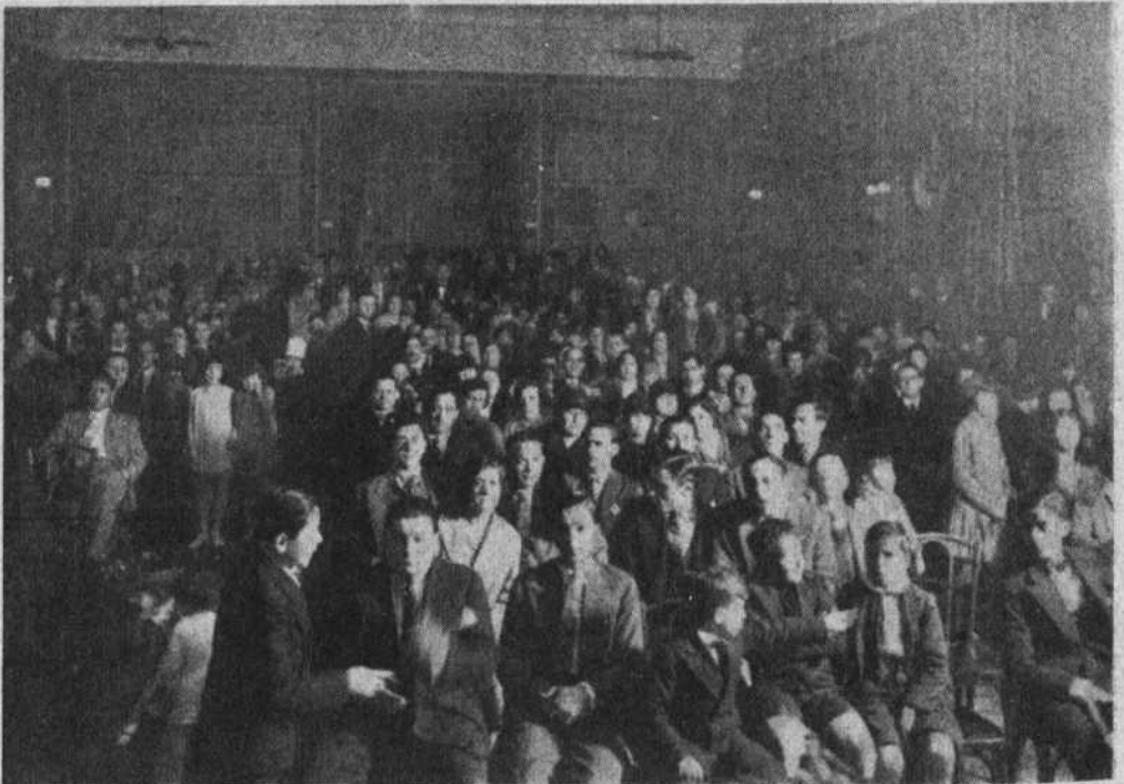
EL SALÓN DURANTE LA VELADA