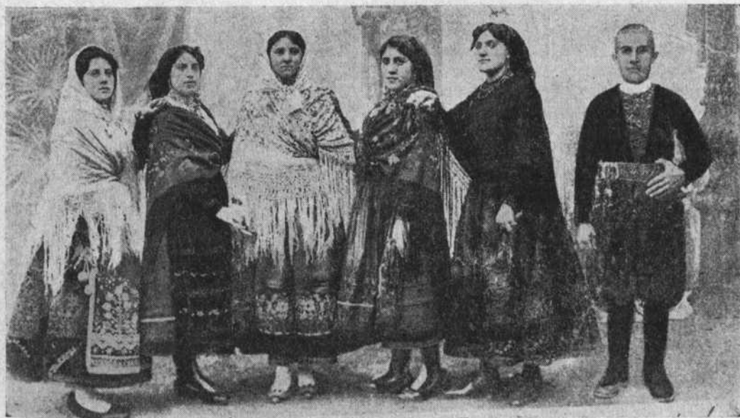
TRAJES DE MARAGATO, PARAMESA Y RIVERANA

Otra cosa es Margateria, región interesantísima y desconocida a pesar de una