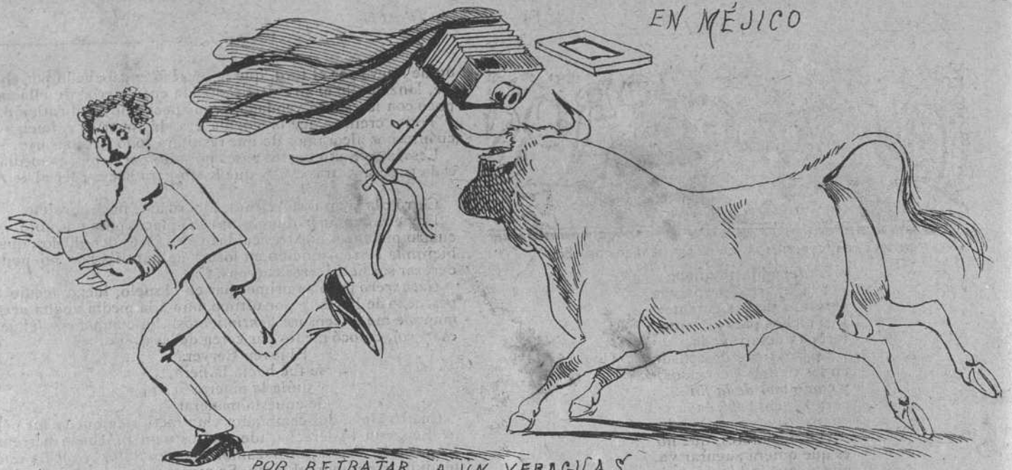
POR RETRATAR A UN VERAGUAS.