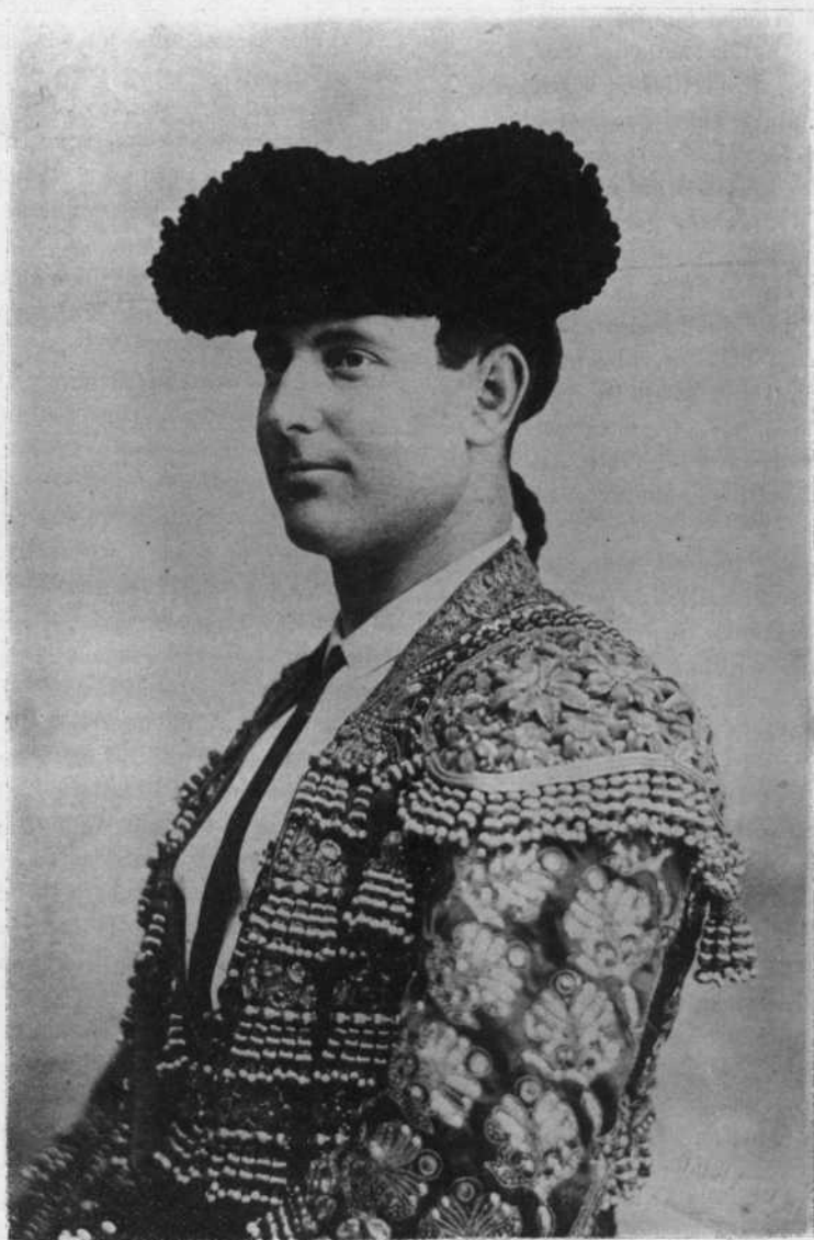
Tip. El Universal.—O'Donnell 34.