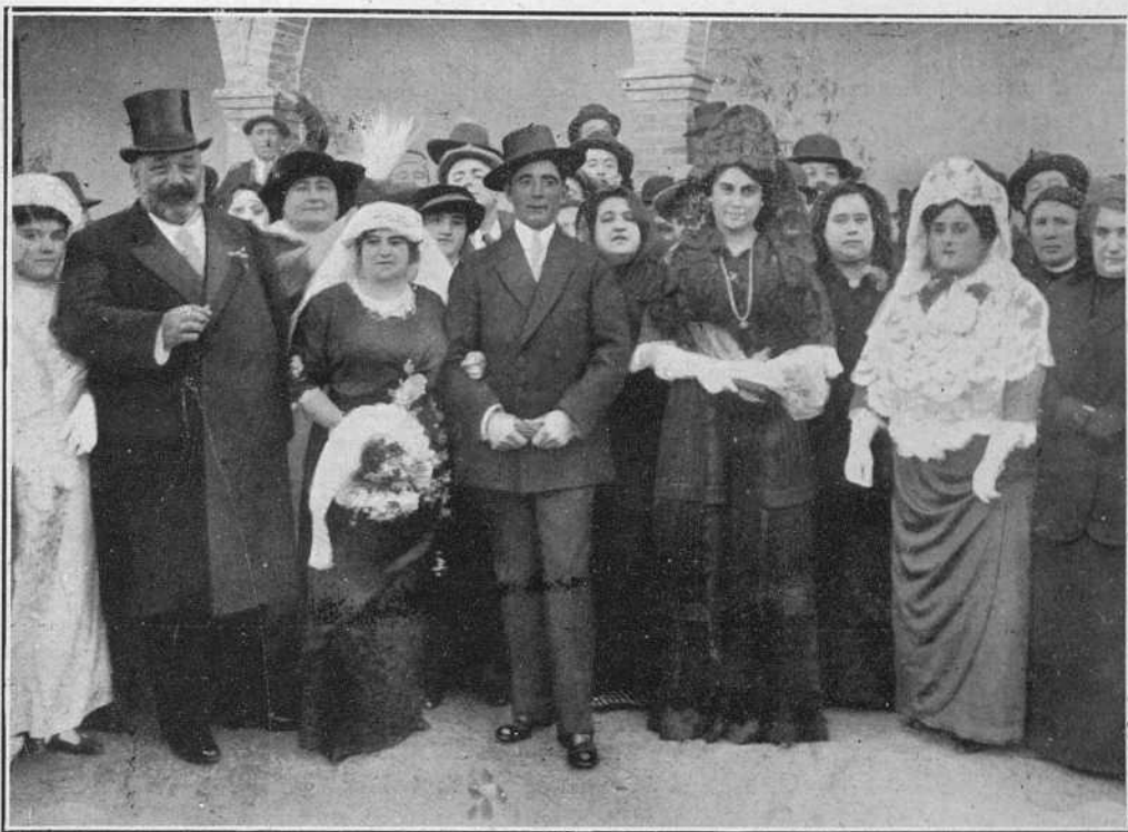
Los novios y padrinos (Sr. Urcola y su bella esposa) al salir de la Iglesia.