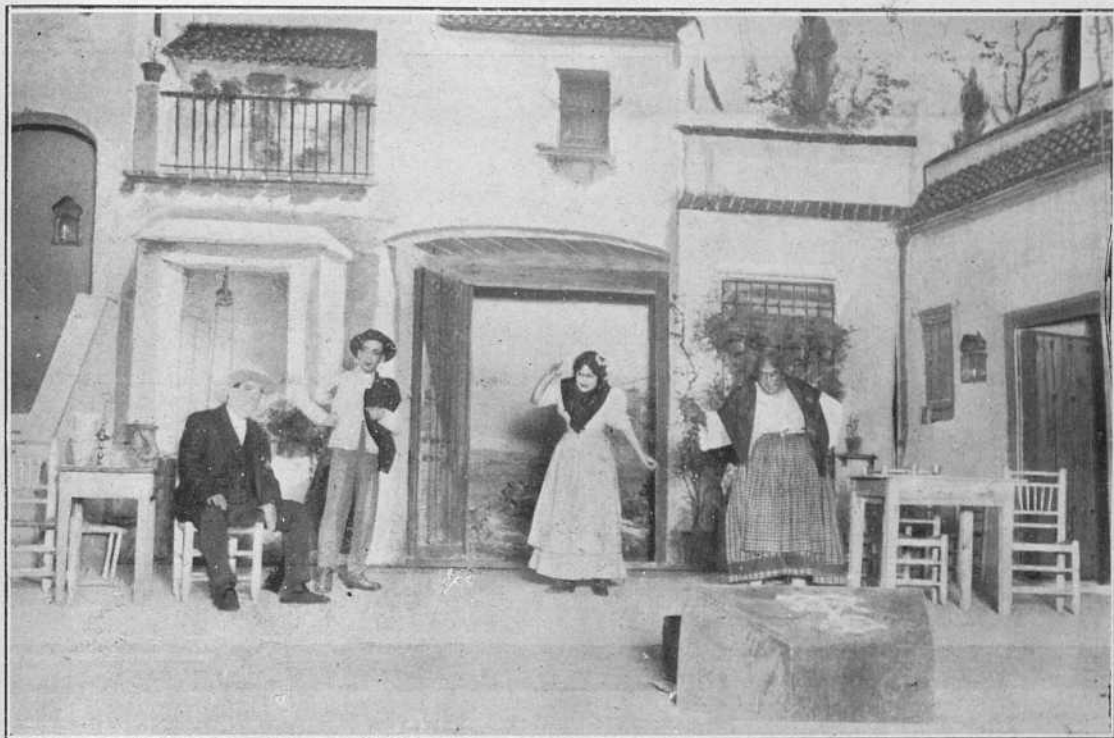
Una de las principales escenas de «Amor bandolero.»

drama interesante, que ya, a trozos, había sido muy bien