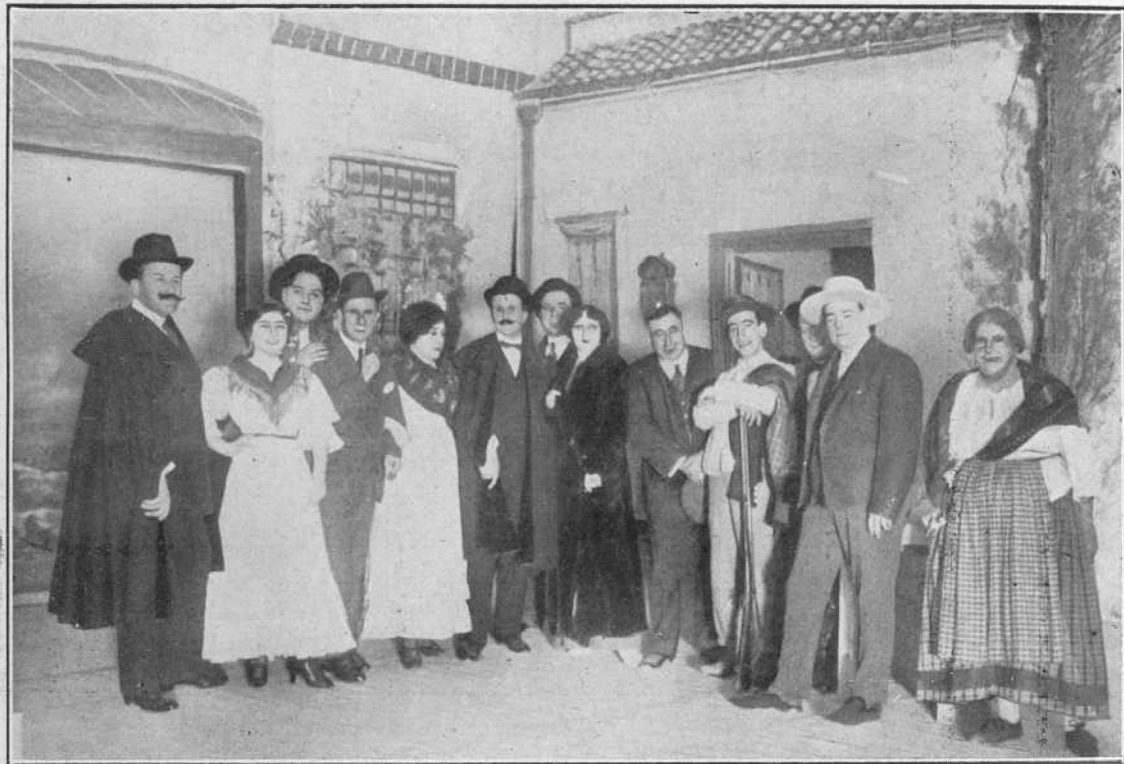
Los hermanos Quintero con los artistas que han desempeñado su última zarzuela.

adaptación a la escena española de Le demoiselle du ma-