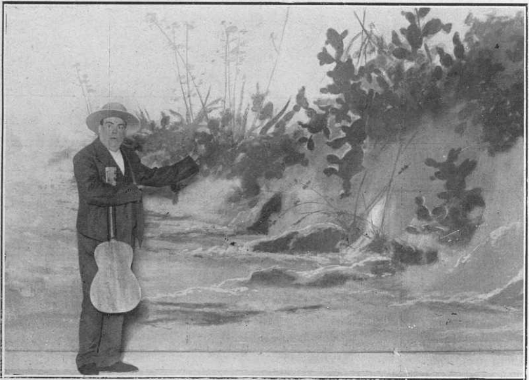
El señor Ortas en una de las escenas más graciosas de «Amor bandolero».

blaban, no sabemos si de miedo o por estar la decoración mal montada, o por las dos cosas. La contralto Nini Frascani triunfó como señora preciosa y como señora cantante, siendo llamada a escena en los tres actos. Dirigió la orquesta, muy bien por cierto, Arturo Saco del Valle. Y no