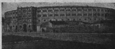
La plaza de Murcia