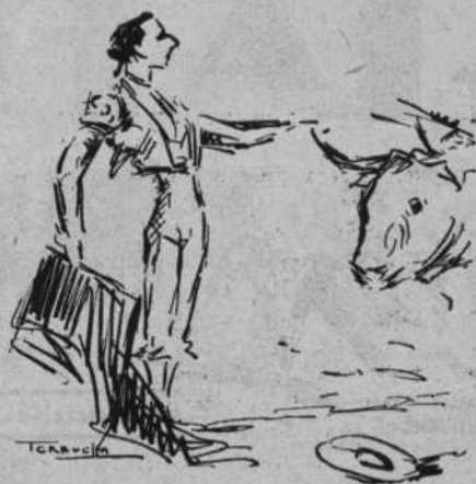
VICENTE BARRERA figura cumbre de la temporada mejicana

Segundo: Chico, escobillado, Cagancho, nos pone de pie, para admirar tres lances imponentes con los pies juntos, en distintos terrenos de la plaza, más al tercero, se revuelve el bicho y entonces cargando la suerte, borda, esta es la palabra, seis verónicas y una media, imposibles de mejorar. ¡Y decían que venía acabado! La plaza es un manicomio. En el primer quite dobla en dos ocasiones y termina con imponderable revolera. Ovación indescriptible, sombreros, todavía se adorna con capotazos llapiserescos, para poner al toro en suerte, y el público vuelve a rugir de entusiasmo. En su turno Balderas torea a la gaonera, no de frente por detrás, enormes, haciéndonos recordar al Idolo ido,