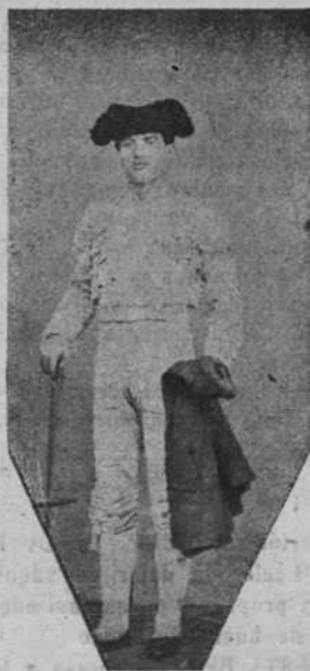
RAFAEL MOLINA LAGARTIJO