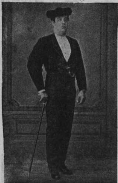
FRANCISCO ARJONA CURRITO

En la corrida de inauguración del año 1874, costó el tendido de sombra 18 reales y 10, el de sol. Dichosos tiempos aquellos en que por tan poco dinero se podía ver una corrida de postín y nada menos que diez toros. ¡Claro, que todo ha subido en proporción!