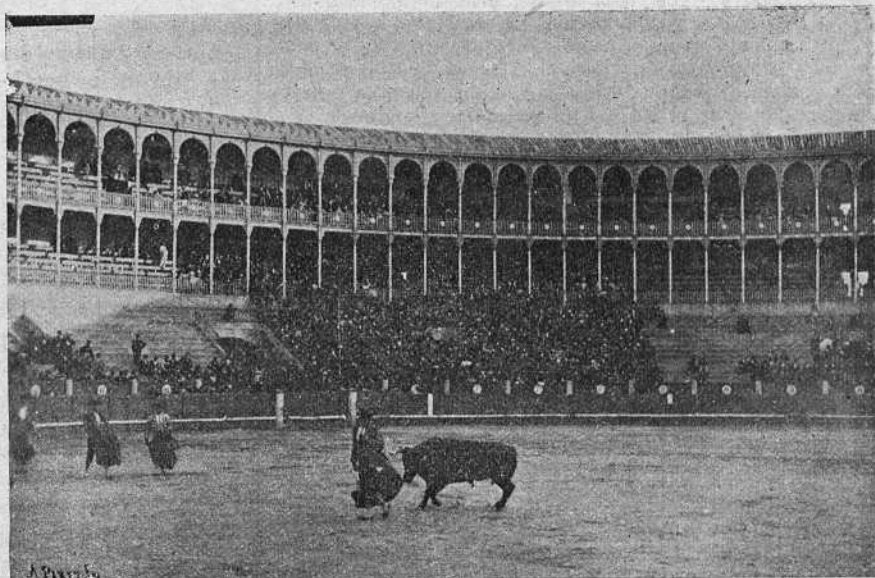
Bonarillo rematando un quite en el segundo toro.