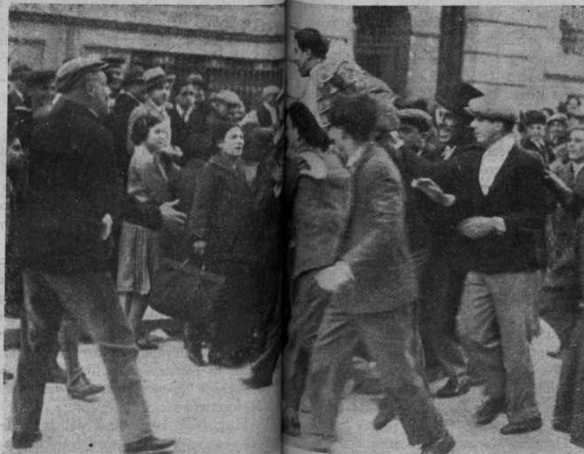
Así acaba sus Carnicerito de Méjico