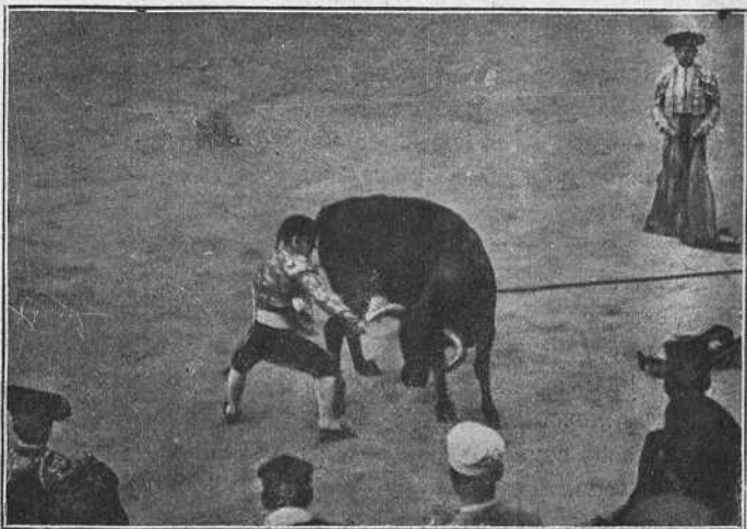
UN QUITO DE •REVERTITO• AL PICADOR •FAJARDO•

y la entrada fué para ganar algunas pesetillas, con ceros detrás.