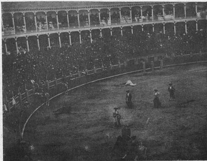
•LAGARTIJILLO• PASANDO DE MULETA Á SU PRIMER TORO

Hizo esfuerzos por agradar; pero no lo consiguió, pues solo estuvo discreto , con el trapo; bastante deficiente, con el estoque, y aceptable en la brega y quites.