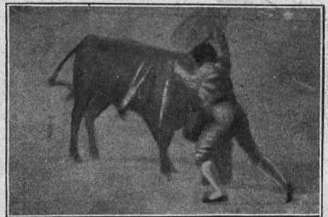
«COCHERITO» EN SU PRIMER TORO

COCHERITO DE BILBAO (azul y oro). Su primer toro que era tuerto del derecho, llegó á sus