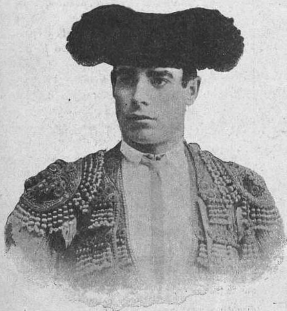
RAFAEL MOLINA «LAGARTIJO»

Los toros fueron nobles, bravos y duros, dando fuertes costaladas á Pino (que quedó conmocionado) Faufán y Arriero . Este ingresó en la enfermería.