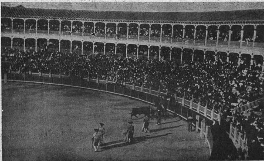
UNA PUYÁ DE BRAZOFUERTE.

Montas. Se esperaba, con grandes deseos, ver á este diestro, ya que tanto y tan bueno se ha hablado, de sus campañas en Méjico y, á decir verdad y á fuer de imparcial, he de confesar que se debió dejar por allá lo digno de aplauso,