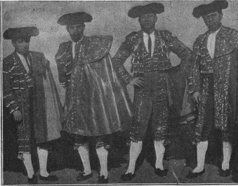
LOS MATADORES ANTES DE LA CORRIDA

El público que no las desconoce, le exige con razón, más de lo que hizo el pasado domingo.